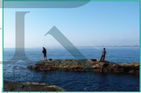
حرفة صيد الأسماك