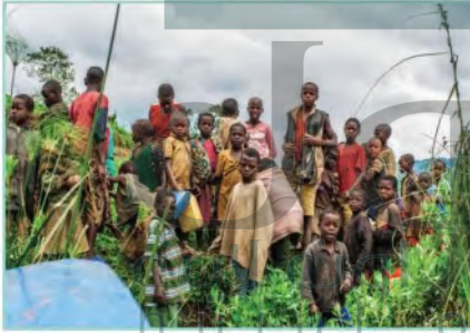
حياة سكان غابات إفريقيا

ومن الجماعات الأخرى التي تمارس الصيد الإسكيمو الذين يعيشون في الجهات القطبية في شمال أمريكا الشمالية ويصيدون الثعالب القطبية وعجل البحر والدببة والأسماك، كما يحترف الهنود الحمر في حوض الأمازون الصيد. وفي المناطق الساحلية والبحيرات وبعض الأنهار تكثر حرفة صيد الأسماك، حيث تُعدّ هذه الحرفة النشاط الرئيس لسكان الجهات الساحلية الجبلية في غرب أوروبا.