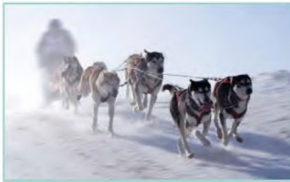
حياة سكان الإسكيمو