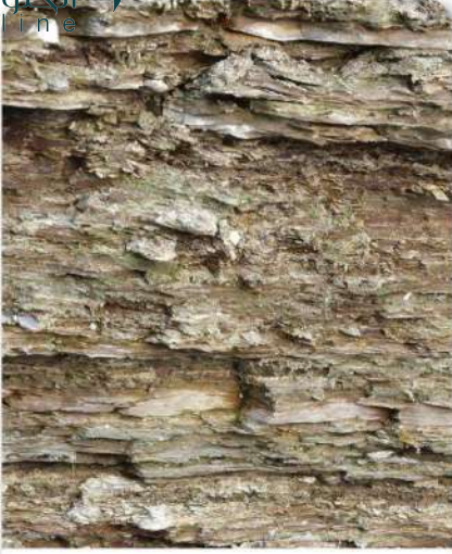
الشكل 11-3 ترسبت الرسوبيات الناعمة جداً في مياه هادئة وشكلت طبقات رقيقة من الطين.

من خصائص الصخور الرملية المهمة أن مساميتها عالية نسبياً. والمسامية Porosity هي النسبة المئوية للفراغات الموجودة بين الحبيبات المكونة للصخر. وقد تصل مسامية الرمل المفكك إلى 40%. ويمكن المحافظة على هذه الفراغات في أثناء تحول الرمل إلى حجر رملي، مما يؤدي غالباً إلى وجود مسامية قد تصل نسبتها إلى 30%. وعندما تكون المسام بعضها متصلاً ببعض تستطيع الموائع ومنها المياه أن تتحرك خلال الحجر الرملي بسهولة. وهذه الخاصية تجعل طبقات الصخور الرملية مهمة بوصفها خزانات تحت سطحية للنفط والغاز الطبيعي والمياه الجوفية.