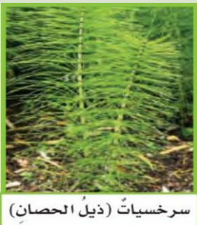
سرخسيات (ذيل الحصان)

و البوغ : خلية تكاثرية تنتج نباتاً جديداً يشبه النبات الأب ويكون لها غلاف خارجي صلب يحميها من الجفاف مثال: ذيل الحصان