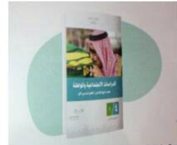
كتاب الدراسات الاجتماعية والمواطنة

س ٤ / ما الترتيب الصحيح للأحداث الآتية وفق التسلسل الزمني بالأقدم ( من ١ إلى ٣ ) ؟