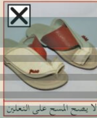
لا يصح المسح على التعلين

أغبر جواربي وأنظفها باستمرار، حتى لا تتغير رائحتها فأؤدي إخواني وزملائي.