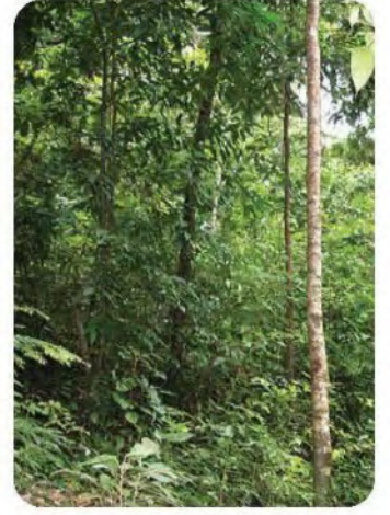
الشكل 7-1 تعد هذه الأشجار موطناً لمجتمع حيوي من المخلوقات الحية التي تعيش عليها.

أصل المخلوقات الحية التي تعيش معاً في مجتمع حيوي بعضها مع بعض باستمرار، وتحدد هذه العلاقات والعوامل اللاحيوية معالم النظام البيئي. وتشمل علاقات المتبادلة: التنافس على الاحتياجات الأساسية كالغذاء والمأوى ووجود لديك التزاوج، بالإضافة إلى العلاقات المتبادلة الأخرى بين المخلوقات الحية لازمة لبقائها.