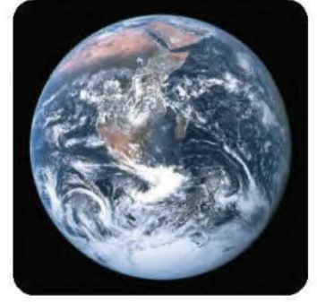
■ الشكل 1-3 تبين صورة الأقمار الاصطناعية للأرض جزءاً كبيراً من الغلاف الحيوي.

ويدرس علماء البيئة هذه المخلوقات والعوامل الموجودة في بيئاتها، وتقسم هذه العوامل إلى مجموعتين، هما: العوامل الحيوية، والعوامل اللاحيوية.