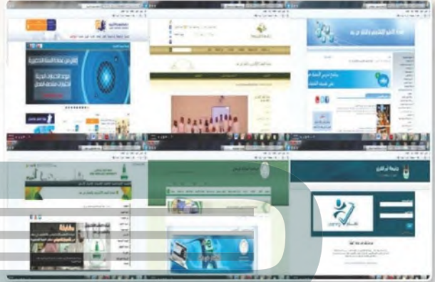
شكل (٤-٦) واجهات مواقع جامعات تقدم خدمة التعليم عن بعد

إن ما نشهده اليوم من تطور في تقنية المعلومات وسرعة الاتصالات وانتشار الوسائل التقنية، يدفع إلى تبني التعلم الإلكتروني والتعليم عن بعد. فقد أصبح قطاع التعليم مطالباً بالبحث عن أساليب جديدة لتقديم خدمة التعليم وخاصة التعليم العالي وتسهيل الوصول إليها. سنتعرف فيما يأتي على مفهوم الجامعة الإلكترونية ومزاياها وبعض الأمثلة عليها. و يبين الشكل (٤-٦) صوراً لواجهات مواقع بعض الجامعات السعودية التي تقدم خدمة التعليم عن بعد.