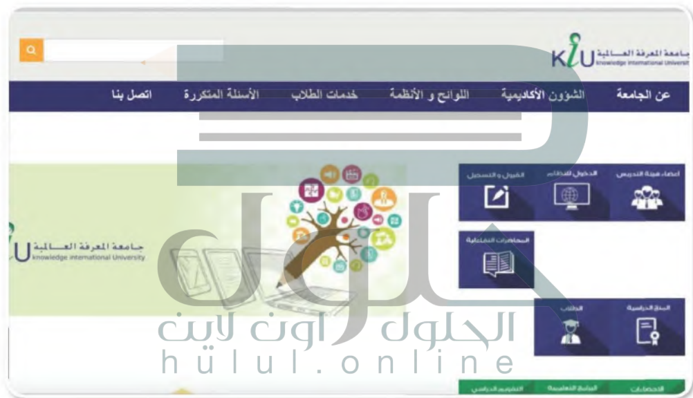
شكل (٨-٤) واجهة موقع جامعة المعرفة العالمية

جامعة المعرفة العالمية هي جامعة تعتمد على تقنية المعلومات والاتصالات لتقديم التعليم الجامعي للجميع في كل مكان، وتعتمد الجامعة أسلوب التعليم عن بعد باستخدام الوسائل الإلكترونية (شبكة الإنترنت بشكل رئيس)، وتمنح الجامعة حاليًا درجة البكالوريوس في تخصصي الشريعة والدراسات القرآنية، ويتضمن تخصص الدراسات القرآنية القراءات وعلوم القرآن والتفسير، وقد استقطبت الجامعة في هيئة التدريس كبار العلماء كما يوضح الشكل الشكل (٨-٤) واجهة موقع الجامعة.