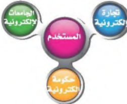
شكل (١-٤): أهم الخدمات المقدمة إلكترونياً

VISION 2030 National Development Strategy