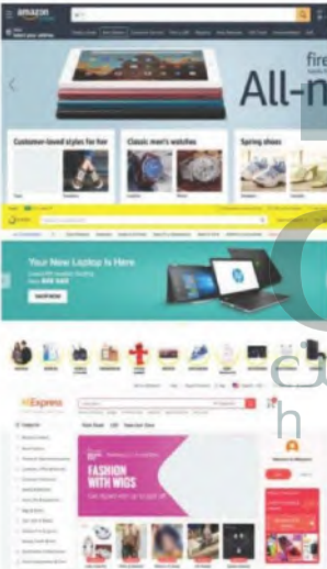
شكل (٤-٥) صور لمجموعة من مواقع التسوق الإلكتروني