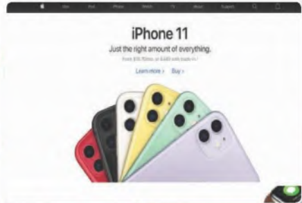
شكل (٤-٤) موقع آبل ستور يعرض منتجات الشركة إلكترونياً

٤ عميل لعميل (C2C): التعاملات التجارية بين المستهلكين ومن أشهر الأمثلة عليها المتاجر الإلكترونية الشخصية.