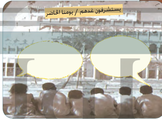
يستشرفون غدهم / يومنا الحاضر