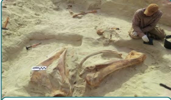
استخراج عظام الكتف والعضد لأحد الفيلة المنقرضة في رواسب البحيرات القديمة في صحراء النفود