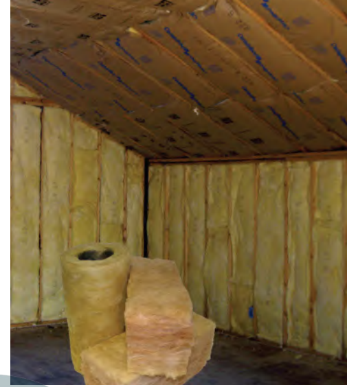
الشكل ٧ تعمل المواد العازلة في المنازل والبنائيات على التقليل من انتقال الطاقة الحرارية بين الهواء داخل المنزل والهواء خارجه.

تُبنى المنازل بحيث تحتوي جدرانها على طبقة من المواد العازلة لمنع انتقال الطاقة الحرارية عبر الجدران بين داخل المنزل وخارجه. ويبين الشكل ٧ استخدام الصوف الصخري للعزل المنزلي. وكذلك يوضع زجاج مزدوج لأبواب بعض النوافذ وثلاجات العرض، بحيث يحصر لوحا الزجاج بينهما طبقة من الهواء أو غازاً عازلاً آخر، فتزداد فاعلية التكييف في المنزل أو فاعلية التبريد في الثلاجة.