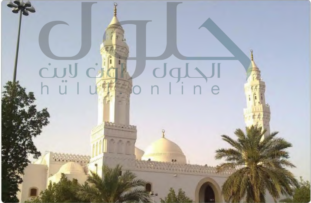
مسجد القبلتين بالمدينة المنورة

ونزل الأمر من الله تعالى بتحويل القبلة إلى مكة المكرمة في قوله تعالى: ﴿قَدْ رَأَى ثَقَلُوبُ وَجْهَكَ فِي السَّمَاءِ فَلْتَوَلَّيْنِكَ قِبَلَةً رَضِيَهَا قَوْلٌ وَجْهَكَ شَطْرَ الْمَسْجِدِ الْحَرَامِ وَحَيْثُ مَا كُنْتُمْ فَوَلُّوا وُجُوهَكُمْ شَطْرَهُ﴾ [البقرة: ١٤٤]. وجاء في كتب السيرة النبوية أن النبي محمداً ﷺ كان في زيارة لأم بشر بنت البراء فنزلت عليه الآية وأبلغ الصحابة رضي الله عنهم وتحولوا في صلاتهم إلى الكعبة المشرفة في مكة المكرمة. وما زال في المدينة المنورة مسجد القبلتين الذي تحول فيه الصحابة في صلاتهم فاستقبلوا مكة المكرمة بعدما جاءهم الخبر بنزول الآية.