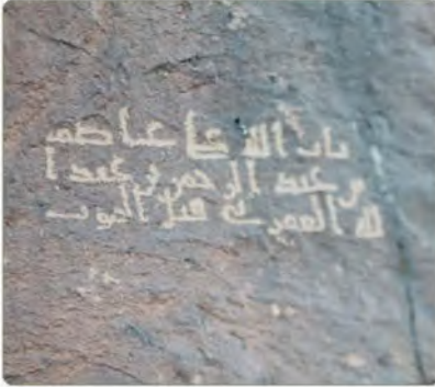
نقش الخط المديني على سفوح جبال المدينة المنورة

كما أسفرت الكشوف الأثرية عن موقع قديم جداً في منطقة الرياض بين تثليث ووادي الدوأسر، وهو موقع (المقر) الذي وجدت فيه شواهد على حضارة يصل عمرها إلى نحو تسعة آلاف سنة، وعلى أقدم استئناس للخيل في العالم.