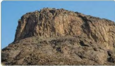
جبل النور بمكة المكرمة

ولأن حوادث سيرة خير البشر وخاتم الأنبياء محمد ﷺ، وسير الخلفاء الراشدين، وبعض حوادث الدولتين الأموية والعباسية كانت على أرض شبه الجزيرة العربية، فإن كثيراً من مواقعها ومعالمها تحظى بعناية المملكة العربية السعودية، بدراساتها والمحافظة عليها وتهيتها. وتولي وزارة الثقافة بالمملكة العربية السعودية هذه المواقع عناية خاصة في برنامج (العناية بمواقع التاريخ الإسلامي) ضمن برنامج أشمل هو (برنامج خادم الحرمين الشريفين للعناية بالتراث الحضاري)، الذي يقوم على توثيق تلك المعالم والمواقع وتأهيلها وتطويرها، وإصدار الدراسات العلمية، وتعزيز جوانبها الحضارية والتاريخية. ومن هذه المعالم التاريخية الإسلامية على سبيل المثال لا الحصر: