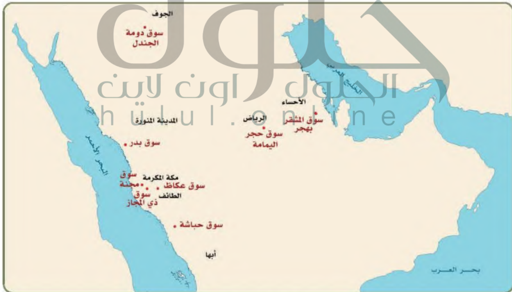
أبرز مواقع أسواق العرب في شبه الجزيرة العربية

وما يميز هذه الأسواق الحضارية لعرب شبه الجزيرة العربية أنها تجذب كثيرا من سكان الشام ومصر والهند والعراق وغيرها. وكانت تلك الأسواق تمثل المكانة الحضارية لعرب شبه الجزيرة العربية ووسيلة اتصال بالشعوب والحضارات الأخرى خارج شبه الجزيرة العربية.