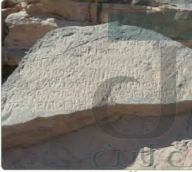
نقش من حمى - نجران

هي المؤلفات التي كتبت باللفتين اليونانية واللاتينية في حقبة قديمة جداً قبل الإسلام، أي من القرن الخامس قبل الميلاد حتى القرن الثالث الميلادي.