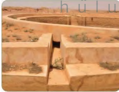
بركة التليمة في درب زبيدة بمنطقة الحدود الشمالية