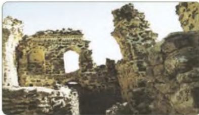
قصر سعيد بن العاص

يعود بناء هذا المسجد إلى عهد الخليفة عمر ابن الخطاب، وهو في دومة الجندل بمنطقة الجوف.