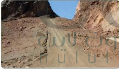
طريق الهجرة النبوية