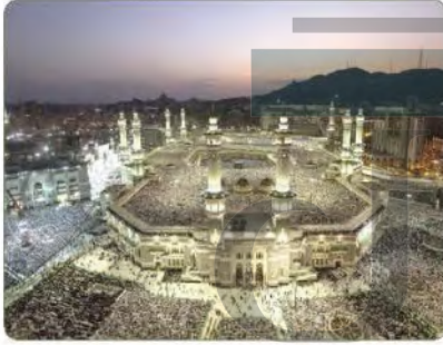
المسجد الحرام بمكة المكرمة

مساحة شبه الجزيرة العربية نحو ٣,٥ ملايين كم ٢ ، وتشغل المملكة العربية السعودية قرابة ثلثي مساحتها، أي نحو مليوني كيلومتر مربع.