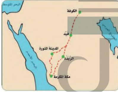
مسار درب زبيدة

مسافته من الكوفة إلى مكة المكرمة نحو ١,٥٠٢ كم، وعدد محطاته ٥٧ محطة، وتقطع قافلة الحج الطريق على ظهور الجمال في مدة تصل إلى شهر.