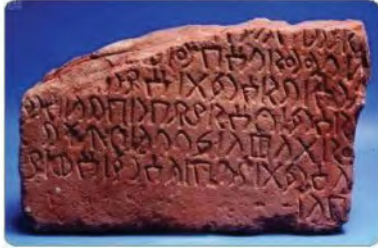
نقش بالخط النبطي