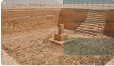
بركة التليماء في درب زبيدة

موضع لأشهر أسواق العرب قبل الإسلام وفي عصر صدر الإسلام، وهو على مسافة ٤٠ كم شمال مدينة الطائف. كان سوقاً للعرب، ومنتدى للشعراء، وملتقى اجتماعياً كبيراً لقبائل العرب.