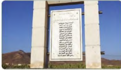
موقع غزوة بدر الكبرى

شهد هذا الموقع البيعة التاريخية بين النبي محمد ﷺ والأوس والخزرج، ويقع في منى على مسافة نحو ٣٠٠ متر من جَمْرَةِ الْعَقَبَةِ، وقد بني في موضع البيعة مسجدٌ سُمِّي باسم مسجد البيعة.