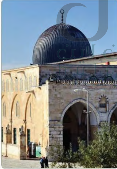
المسجد الأقصى بالقدس

منذ ذلك التاريخ ومكة المكرمة مهبط الوحي هي قبلة للمسلمين في جميع أنحاء العالم وإلى اليوم، ولهذا تحرص حكومة وطني المملكة العربية السعودية على العناية بالمسجد الحرام والكعبة المشرفة والمسجد النبوي والمشاعر المقدسة، وخدمة الحجاج وتتشرف المملكة والمواطنون فيها بخدمة الحرمين الشريفين وحمل المسؤولية، وبأن الوطن فيه قبلة المسلمين ومثوى النبي ﷺ.