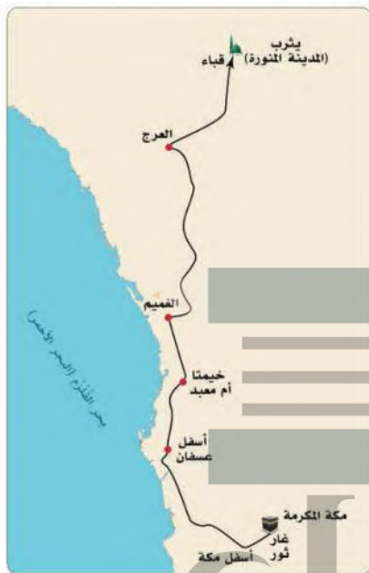
طريق الهجرة النبوية