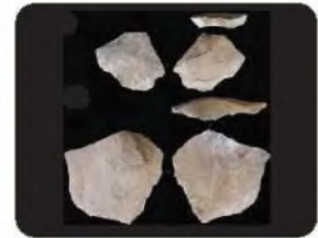
بعض الأدوات الحجرية القديمة في موقع الشويحطية