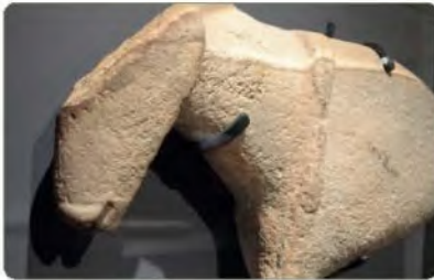
مجسم أثري لخيول من معثورات حضارة المفر

ثمة حضارات قديمة قامت على أرض شبه الجزيرة العربية بعدد انطلاقة بعضها.