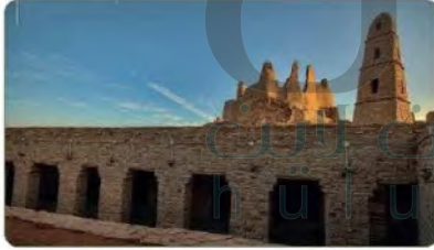
مسجد الخليفة عمر بن الخطاب

طريق للحجاج من الكوفة بالعراق إلى مكة المكرمة، أنشأته زبيدة زوجة هارون الرشيد في عصر الدولة العباسية، ولا تزال كثير من معالم الطريق قائمة؛ من الأبراج، والبرك، والمباني.