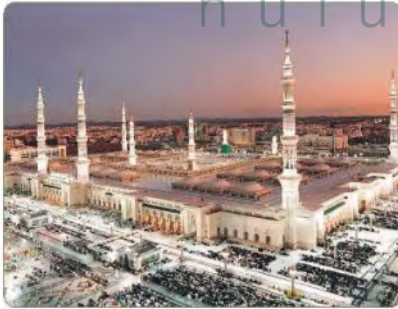
المسجد النبوي بالمدينة المنورة

تَشْغُل المملكة العربية السعودية معظم مساحة شبه الجزيرة العربية، وتقع في الزاوية الجنوبية الغربية من قارة آسيا، لتصبح في موقع متميز جعلها ملتقى لقارات آسيا وإفريقيا وأوروبا.