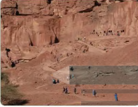
آثار لحيانية في الخريبة بالغلا