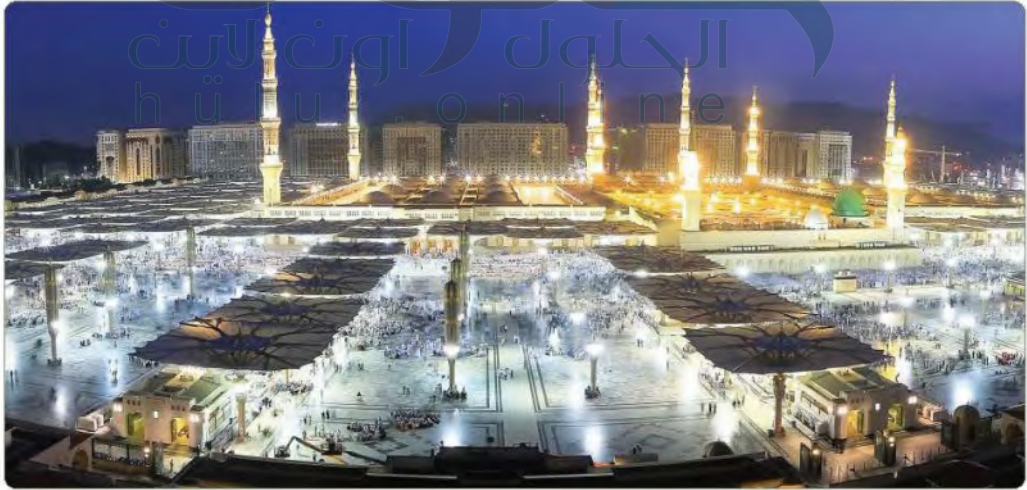
المسجد النبوي بالمدينة المنورة

كان اسم المدينة المنورة قديماً (يَثْرِب)، وكانت تقوم أساساً على الزراعة والرعي، وعندما قدم إليها النبي محمد ﷺ غَيَّرَ اسمها إلى المدينة وَطَيْبَةً أَوْ طَابَةَ. عن جابر بن سَمُرَةَ رَضِيَ اللَّهُ عَنْهُ قَالَ: قَالَ رَسُولُ اللَّهِ ﷺ: «إِنَّ اللَّهَ تَعَالَى سَمَى الْمَدِينَةَ طَابَةَ» [رواه مسلم]. وأورد المؤرخون أسماء أخرى للمدينة المنورة، منها: المطيِّبة، والدار، وجابرة، ومجبورة، ومُنيرة.