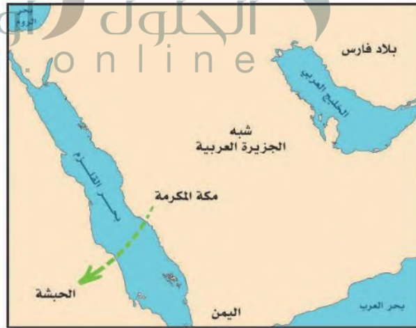
الهجرة إلى الحبشة

تشكل الحبشة قديماً أغلب إثيوبيا حالياً، وتقع شرق القارة الإفريقية، وكان فيها مملكة أكسوم التي استمرت مدة طويلة.