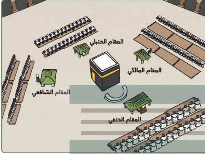
رسم تخيلي لأداء الصلاة في المسجد الحرام قبل عهد الملك عبدالعزيز

فسيطرت قواته على (الليث) و(القنفذة) و(رايغ) و(ينبع النخل) و(العلا)، أما (المدينة المنورة) فقد استسلمت حاميتها للأمير محمد بن عبدالعزيز سنة ١٣٤٤هـ، ولم يلبث علي بن الحسين أن أعلن استسلامه في جدة، في السنة نفسها، فدخلها الملك عبدالعزيز. وبعد أن استتب الأمر في الحجاز، عمل الملك عبدالعزيز لتأمين طرق الحجاج وسلامتهم، كما وحد الصلاة في المسجد الحرام خلف إمام واحد، بعد أن كانت الصلاة الواحدة تقام أربع مرات حسب المذاهب الأربعة: الحنفي، والشافعي، والمالكي، والحنبلي، وكان لكل منهم مقام خاص به.