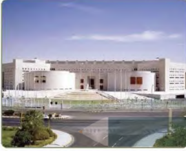
مبنى وزارة الخارجية بالرياض

بدأ وضع النُظُم للدولة في عهد الملك عبدالعزيز بعد سنة (١٣٤٤هـ)، فقد نَظَّم الملك المؤسس الدولة وأصدر الأنظمة اللازمة لخدمة البناء الإداري الجديد. فأنشئت مديرية للشؤون الخارجية، ثم حُولت إلى وزارة سنة (١٣٤٩هـ) وعُيِّن الأمير فيصل بن عبدالعزيز وزيراً لها، وهي أول وزارة أحدثت بصفة رسمية.