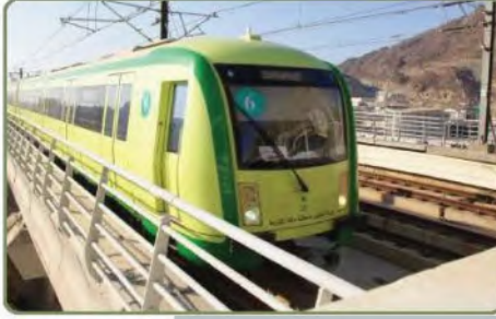
قطار المشاعر المقدسة