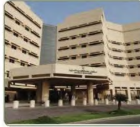
مستشفى جامعة الملك عبدالعزيز بجدة

وفي عهد خادم الحرمين الشريفين الملك سلمان ابن عبدالعزيز -حفظه الله- جرى دمج وزارتي التربية والتعليم، والتعليم العالي، في وزارة واحدة تحت اسم وزارة التعليم.