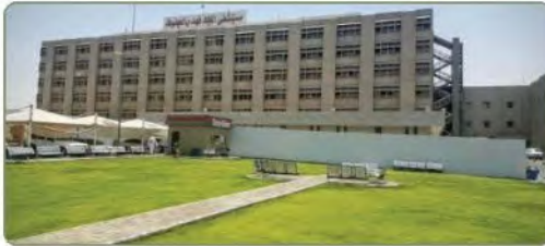
مستشفى الملك فهد بالهتوف

من أبرز الإنجازات الطبية التي تحققت في عهد الملك عبدالله افتتاح (مدينة الملك فهد الطبية) في الرياض، وهي مجموعة متكاملة من المستشفيات والمرافق المساندة، ففي المرحلة التشغيلية الأولى ضمت أربعة مستشفيات، وأربعة مراكز طبية، وإدارات مساندة متنوعة. أما المرحلة الثانية فتمثلت في العمل لأن تكون مدينة الملك فهد الطبية المرجع المعيارى للخدمات الطبية التخصصية على كل المستويات الطبية، وبها أحدث ما توصل إليه الطب الحديث من الأجهزة المتقدمة.