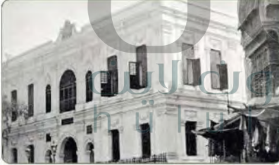
مديرية المعارف بمكة المكرمة أنشئت عام ١٣٤٤هـ

إن من الإنجازات الاجتماعية المهمة في المملكة العربية السعودية ما قام به الملك عبدالعزيز من إنشاء الهجرة التي ركزت في توطيد القبائل في مواضع محددة في أنحاء المملكة العربية السعودية وتوفير البناء والزراعة لهم وتعليمهم ودمجهم في التنمية الشاملة. ولقد بلغت الهجرة التي أنشئت في عهد الملك عبدالعزيز أكثر من مئتي هجرة أصبحت اليوم مدناً متطورة وعامرة بالسكان. وبهذا المشروع يكون الملك عبدالعزيز أسس أول تجربة متميزة في التحول والتطور الاجتماعي الذي خدم جزءاً كبيراً من وطني المملكة العربية السعودية.