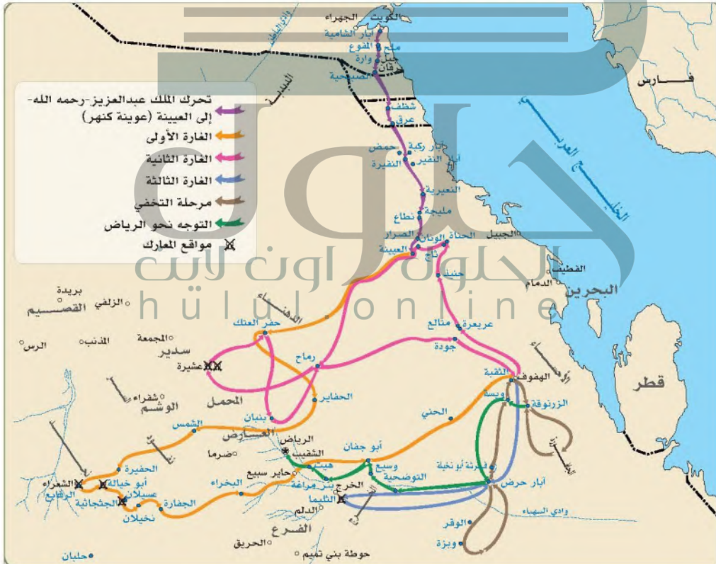
تحركات الملك عبدالعزيز لاسترداد الرياض ١٣١٩هـ