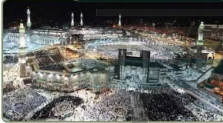
توسعة المسجد الحرام بمكة المكرمة

وأنشئ قطار المشاعر المقدسة في عهد الملك عبدالله بن عبدالعزيز للإسهام في نقل الحجاج وراحتهم وتسهيل حركتهم، ويربط القطار مَشْعَرِ مِنى بمزدلفة وعرفات.