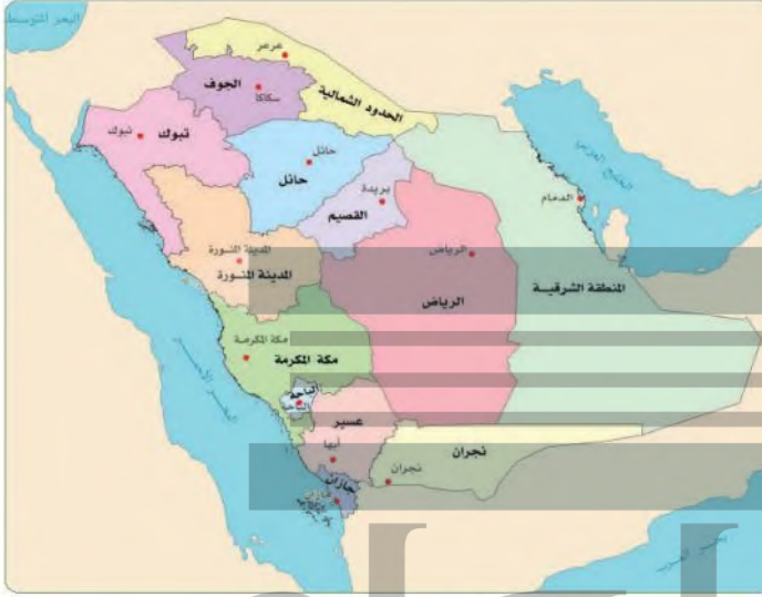
مناطق المملكة العربية السعودية

تقوم المملكة العربية السعودية على أسس عديدة، ومن أبرزها ما يأتي: