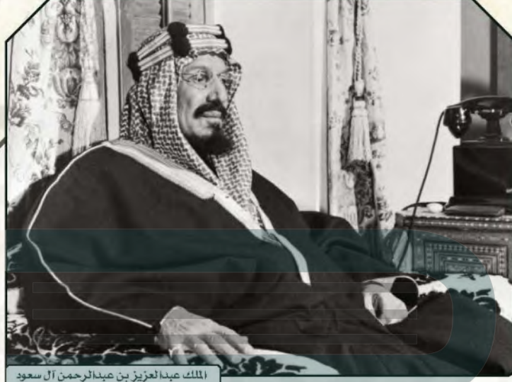
الملك عبدالعزيز بن عبدالرحمن آل سعود

أسس الملك عبدالعزيز بن عبدالرحمن آل سعود المملكة العربية السعودية بعد انتهاء الدولة السعودية الثانية، مؤكداً رسوخ جذور الدولة السعودية ومبادئها، وقدرتها على الظهور من جديد، وتحقيق أسس الدولة الحديثة، ومواكبة التطورات فيها بخدمة الدين والمجتمع والوطن. وتواصل المملكة العربية السعودية اليوم نجاحاتها في تحقيق التنمية والرخاء والاستقرار، وخدمة الإسلام والمسلمين، ومواصلة التطور وفق رؤية مستقبلية هي رؤية ٢٠٣٠ مدعومة بالطموح والإمكانات وجودة التخطيط والتنفيذ.