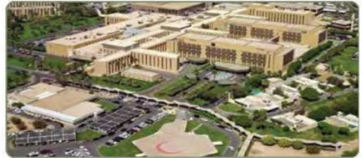
مستشفى الملك فيصل التخصصي ومركز الأبحاث بالرياض