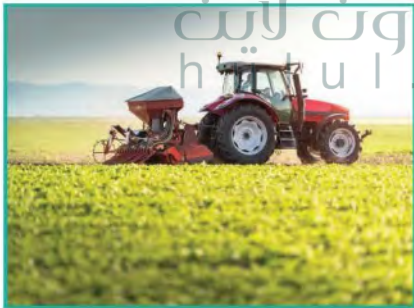
يعمل أغلب سكان القرى في الزراعة والرعي

تشغل التجمعات الريفية أماكن تختلف في أشكالها وأحجامها ومدى تعقيدها، ويمكن تصنيف العمران الريفي إلى قسمين بناءً على مدى استمراره: