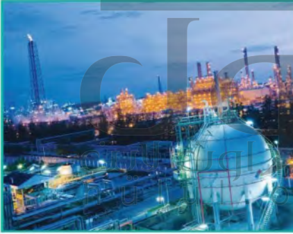
مدينة الجبيل الصناعية

وهي المدن التي تشغل التجارة المركز الأول في أنشطتها المختلفة، وهذا النوع من المدن يقوم عادة عند انقاء طرق المواصلات البحرية والبرية، ومن أمثلتها مدن نيويورك ولندن وطوكيو ودبي.