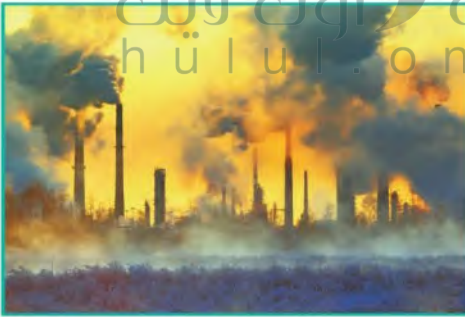
التلوث إحدى المشكلات التي تواجه المدن