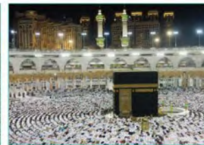
• مكة المكرمة