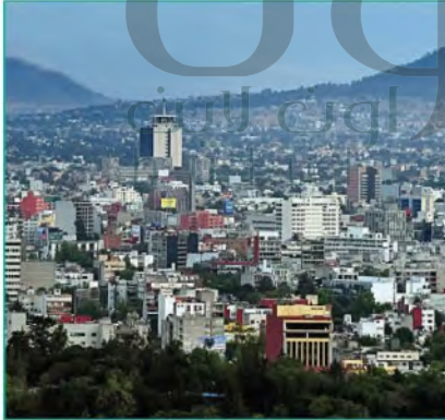
مكسيكو سيتي عاصمة المكسيك من المدن المكتظة بالسكان

وإذا كانت الدول الصناعية قد وضحت فيها النمو السكاني للمدن في النصف الأول من القرن العشرين الميلادي، وخف فيها في وقتنا الحاضر، فإن الدول اننامية بدأت هذا الاتجاه في النصف الثاني من القرن نفسه، وهذا النمو يعود إلى الهجرة من الريف إلى المدن، والزيادة الطبيعية للسكان، وتعد مدينة مكسيكو سيتي عاصمة المكسيك من أسرع المدن نموًا في العالم، حيث يصل معدل النمو فيها إلى ألفي شخص يوميًا، ويتوقع الخبراء أن تكون أكبر مدينة في العالم في السنوات القادمة إذا استمر نموها على هذا النحو.