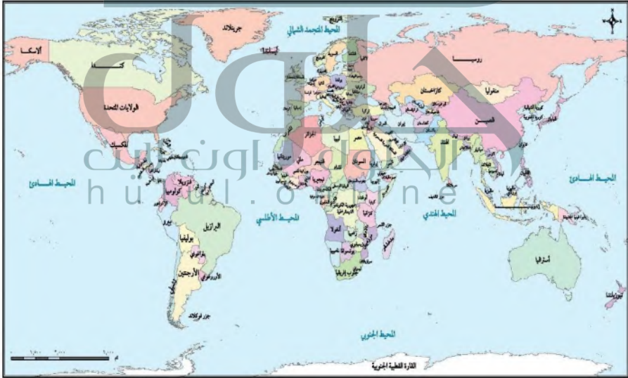
خريطة العالم السياسية

الدولة وحدة سياسية تحكمها حكومة مستقرة تسيطر على شؤونها الداخلية والخارجية، وتشغل منطقة ما من سطح الأرض تضم سكاناً دائمين ولها سيادة؛ أي هي مستقلة عن سيطرة الدول الأخرى على شؤونها الداخلية.