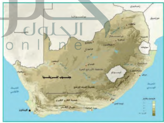
جنوب إفريقيا (الدول المتقوبة)