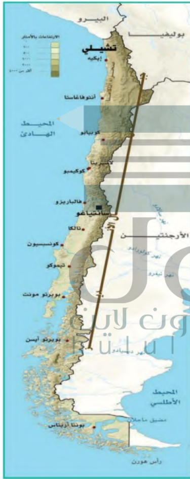
تشيلي (الشكل الممتد)

ثمة بضع دول يمكن تصنيفها بأنها متقوبة. وهي الدولة التي تحيط بها دولة أخرى إحاطة كاملة، مثل ليسوتو في جنوب إفريقيا.