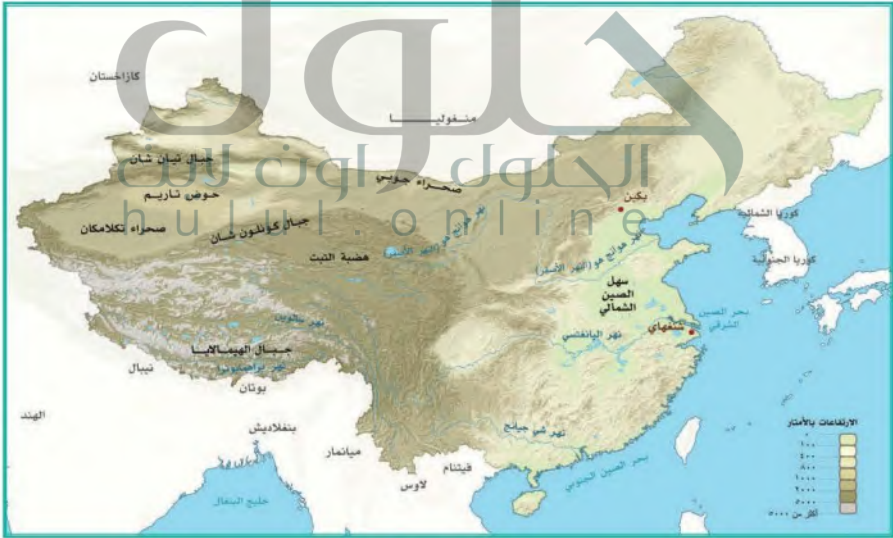
خريطة الصين الطبيعية

تتفاوت دول العالم تفاوتاً كبيراً في مميزات الطبيعة؛ وخصوصاً في جانبي المساحة والشكل. لذا نجد الدول وشكلها ذات المساحة الكبيرة على مر التاريخ تبذل جهوداً لحماية أراضيها.