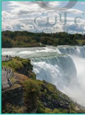
شلالات نياجرا هي البحيرات العظمى التي تشكل حدوداً مائية بين الولايات المتحدة الأمريكية وكندا

ما الفرق بين المياه الإقليمية والمياه الدولية؟