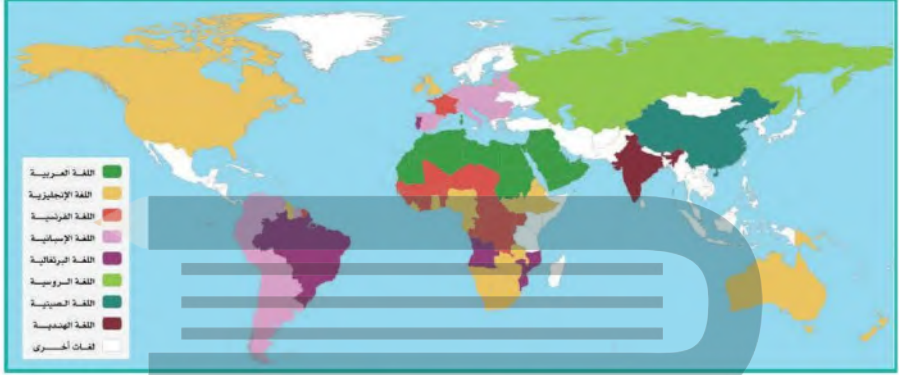
خريطة توزيع اللغات في العالم