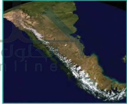
صعوبة تحديد خط تقسيم المياه على جبال الإنديز يقاوم من مشكلات الحدود بين الأرجنتين وتشيلي

وكان لا بد لتلك الحدود من أن تسير مع قمم جبال الإنديز أو مع خط تقسيم المياه. وكادت الدولتان تدخلان في حرب ضروس بسبب خط الحدود قبل أن تتفقا على الخط الذي يصل بين قمم الجبال حداً فاصلاً بين الدولتين.