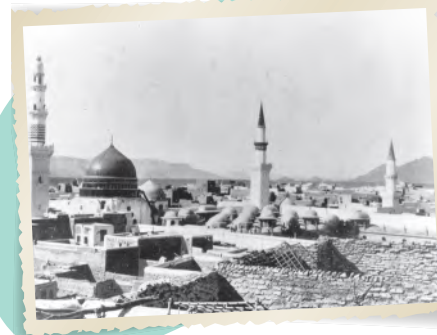
صورة المدينة المنورة عام ١٣٢٦هـ