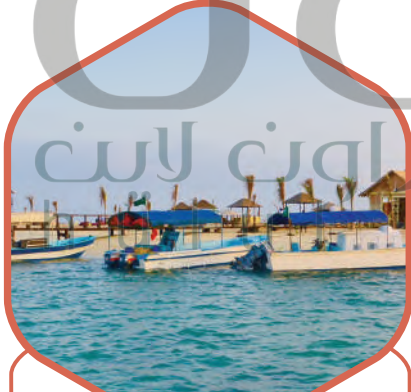
ساحل البحر الأحمر في جازان