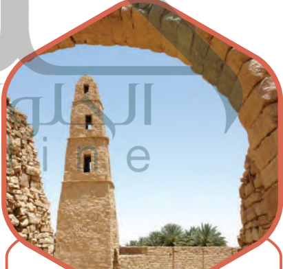
دومة الجندل في الجوف