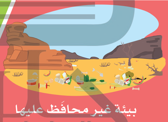
بيئة غير محافظ عليها