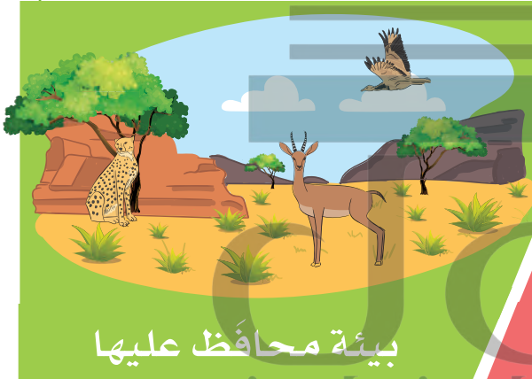
بيئة محافظ عليها