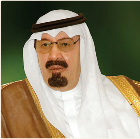
الملك عبدالله بن عبدالعزيز آل سعود

إنَّ الإنسان قد يكون سبباً في تدمير هذا الكوكب بكل ما فيه، وهو قادر أيضاً على جعله واحة سلام واطمئنان، يتعايش فيه أتباع الأديان والمذاهب والفلسفات ويتعاون فيه الناس بعضهم مع بعض باحترام. ويواجهون المشكلات بالحوار لا بالعنف. إنَّ الإنسان قادر على أن يهزم الكراهية بالمحبة والتعصب بالتسامح، وأن يجعل جميع البشر يتمتعون بالكرامة التي هي تكريم الرب - جل شأنه - لبني آدم أجمعين.