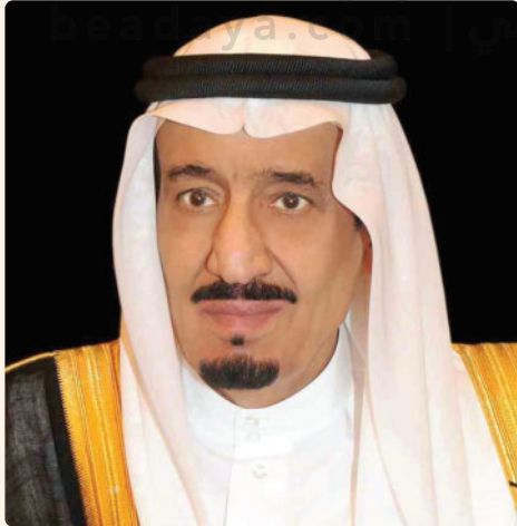
خادم الحرمين الشريفين الملك سلمان بن عبدالعزيز آل سعود