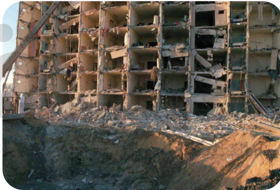
تفجير إرهابي - الخبر - ٢٥ يونيو ١٩٩٦م

مقطع من بيان هيئة كبار العلماء في جماعة الإخوان المسلمين الإرهابية