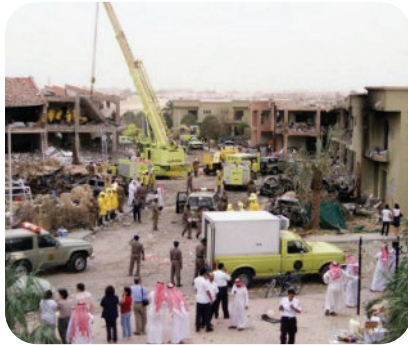
تفجير إرهابي - الرياض - ٨ نوفمبر ٢٠٠٢م