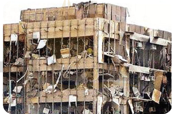
تفجير إرهابي - الأمن العام الرياض - ٢١ أبريل ٢٠٠٤م