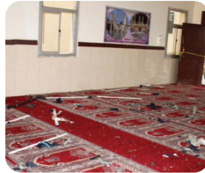
تفجير إرهابي - عسير - ٦ أغسطس ٢٠١٥م