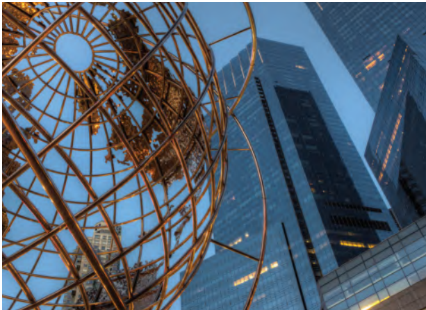
ما هي بعض مزايا الاستراتيجية متعددة الجنسيات؟

تقوم الشركات متعددة الجنسيات (Multinational Company (MNC بأعمال تجارية في العديد من البلدان. عادة ما تتألف الشركات متعددة الجنسيات من "الشركة الرئيسية" في بلد المنشأ وفروع أو شركات منفصلة في بلدان أخرى. يسمى البلد الآخر الذي تنفذ فيه الشركة متعددة الجنسيات أعمالها "البلد المضيف".