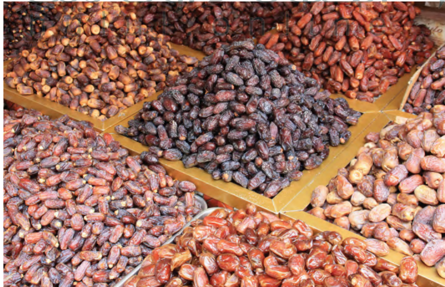
لماذا تهتم الشركات السعودية بالتصدير؟

تعتمد غالبية الدول التي تُزاوَل أعمال التجارة الدولية على منظمة التجارة العالمية (World Trade Organization (WTO) للتفاوض بشأن الاتفاقيات التجارية. منظمة التجارة العالمية هي المنظمة الدولية الوحيدة التي تُدير شؤون التنظيمات التجارية بين الدول.