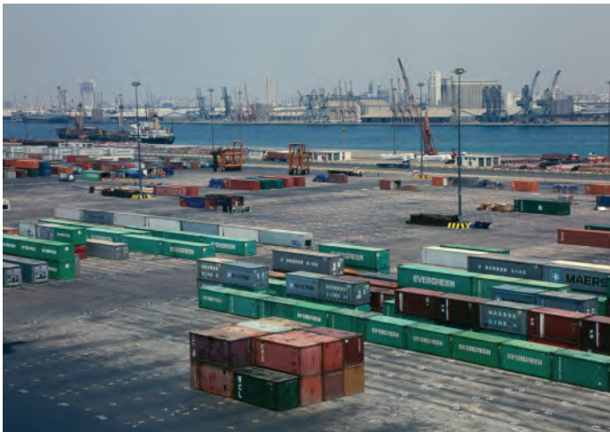
ما مزايا التجارة الدولية وعيوبها؟

تتم معظم الأنشطة التجارية داخل حدود الدولة، وتتمثل "الأعمال التجارية المحلية" في تصنيع السلع وتسويقها وبيعها وتوفير الخدمات اللازمة داخل الدولة. أما مصطلح "الأعمال التجارية الدولية" فيشير إلى الأنشطة التجارية اللازمة لتجهيز السلع والخدمات وشحنها وبيعها عبر الحدود الوطنية. وكثيرًا ما يشار إلى الأعمال التجارية الدولية باسم "التجارة الخارجية" أو "التجارة الدولية"، ويمكن ملاحظة مظاهر التجارة الخارجية حولنا في كل مكان.