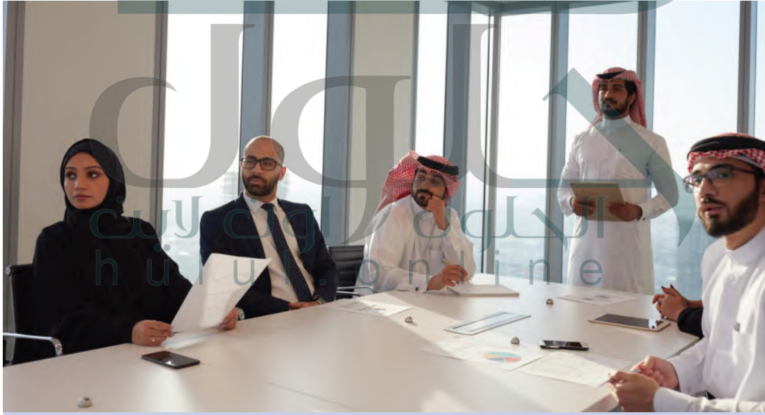
لماذا يجب على الشركات مراعاة مصالح كافّة الأطراف المستفيدة؟

يُقصد بحوكمة الشركات Corporate governance نظام القواعد، والممارسات، والعمليات الذي يحدّد كيفية توجيه الشركات وإدارتها والتحكم فيها. يجب أن توازن حوكمة الشركات بين مصالح الأطراف المعنية المتعدّدة في الشركة، أو بعبارة أخرى أصحاب المصلحة في الشركة، ويمكن أن تشمل الأطراف المعنية كلّاً من المساهمين (مستفيدي القطاع الخاصّ والمستفيدين الحكوميين)، ومجالس الإدارة، والإداريين، والعملاء، والموردين، والممولّين والحكومات، والمجتمع. تبدأ حوكمة الشركات "بمجلس الإدارة"، وهو الهيئة المشرفة على الشركة. يتولّى مجلس الإدارة عملية وضع استراتيجية الشركة، ويعيّن الرئيس التنفيذي، ويشرف على الإدارة. أما في حالة الشركات العامّة، فينتخب المساهمون مجلس الإدارة. وفي حالة الشركات غير العامّة، يمكن أن يحدّد المالكون، مثل الحكومة أو الأفراد، أعضاء مجلس الإدارة. يمكن أن تؤثر سياسات حوكمة الشركات الفعّالة بشكل مباشر في صورة العلامة التجارية الخاصّة بالشركة، وفي عملية بناء الثقة في العلاقات مع الأطراف المعنية، كما يمكن أن تسهم في زيادة الأرباح. يتضمّن نظام حوكمة الشركة القوي سياسات خاصّة بالوعي البيئي، والسلوك الأخلاقي، والمحاسبية، والشفافية، واستراتيجية مؤسسية قوية، ونظام توظيف وأجر عادل، ونظام لإدارة المخاطر. تمتلك الشركات التي تتمتع بنظام حوكمة فعّال موقعاً إلكترونياً خاصّاً بعلاقات المستفيدين، يُعرّف بهيكل الشركة، ومجلس الإدارة، ويتضمّن وثائق حوكمة الشركة، مثل اللوائح التنظيمية الداخلية، وإرشادات ملكية الأسهم، وعقود التأسيس، والتقارير المالية.