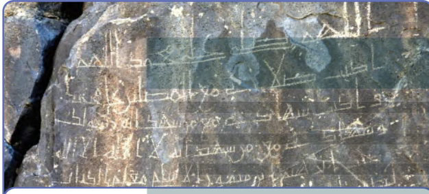
من نوادر الخط المدني: نقش لمُعَلِّم الكُتَّاب إبراهيم بن ميمون الأسلمي كتب في عام ١٣٥هـ على أحد الجبال جنوب غربي المدينة المنورة

هو تدوين الأحداث التي حدثت في الماضي وتفسيرها، وربطها بالتطورات الاجتماعية والحضارية للإنسان في مكان محدد.