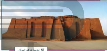
آثار مدينة أور في العراق

العَمُورِيُّونَ (الأموريون) (نحو عام ٢٠٠٠ ق.م):