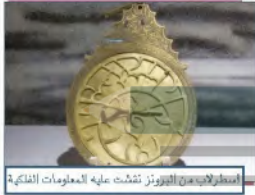
استعمل الخوارزمي النورون لفكش عليه المعلومات الفلكية

وضع المسلمون أسس هذا العلم، إذ استعملوا نظام الترقيم، إضافة إلى اختراع الصفر، كما اعتنوا بعلم الجبر وعلم الهندسة. ومن العلماء المسلمين في هذا المجال أبو عبد الله محمد الخوارزمي.