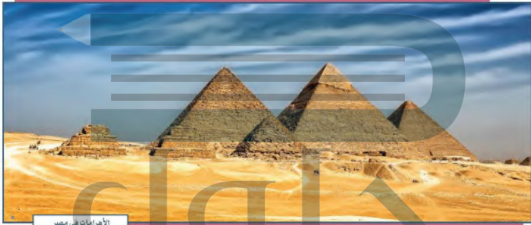
الأهرامات في مصر

٣- الحضارة الصينية: الفترة: ١٦٠٠ - ١٠٤٦ ق.م. الموقع: النهر الأصفر، ومنطقة اليانغسي.