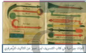
قوات جراحية في كتاب التصريف لمن عجز عن التأليف لأبي بكر بن رزيق

طوّر المسلمون أسس الطب واعتنوا به لارتباطه بصحة الإنسان، فبرعوا في ابتكار الأدوات اللازمة لإجراء العمليات الجراحية، كما أنشؤوا المستشفيات لمعالجة المرضى.