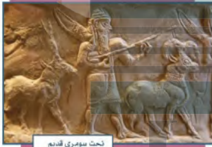
نحت سومري قديم