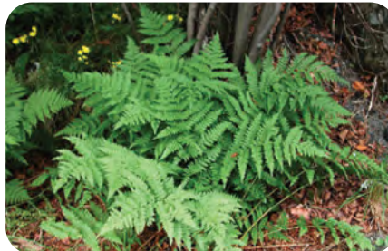
ينمو الخنشار Dryopteris على أفضل صورة في البيئات الجافة الظليلة.

الشكل 5-7 الخنشاريات مجموعة متنوعة من النباتات تعيش في بيئات عديدة.