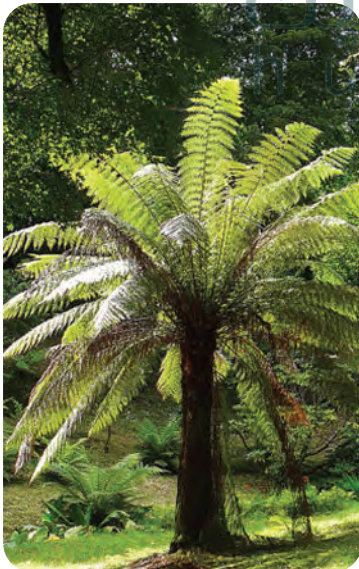
تنتشر أشجار الخنشار بشكل كبير في الغابات الاستوائية.

بمرور الزمن أصبحت جزءاً من الفحم الذي يستخرج في وقتنا الحاضر