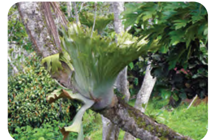
ينمو نبات قرن الأيل بوصفه نباتاً هوائياً على النباتات الأخرى.

الشكل 5-7 الخنشاريات مجموعة متنوعة من النباتات تعيش في بيئات عديدة.