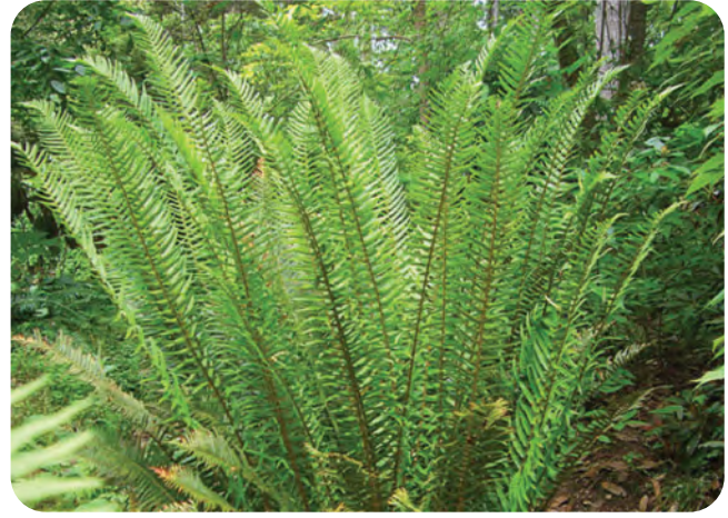
الطور البوغي المكتمل النمو للخنشار

الشكل 8-5 يختلف كل من الطور البوغي والطور المشيجي اختلافاً واضحاً في الحجم والمظهر. فالطور البوغي الناضج للخنشار أكبر مرات عديدة من الطور المشيجي.