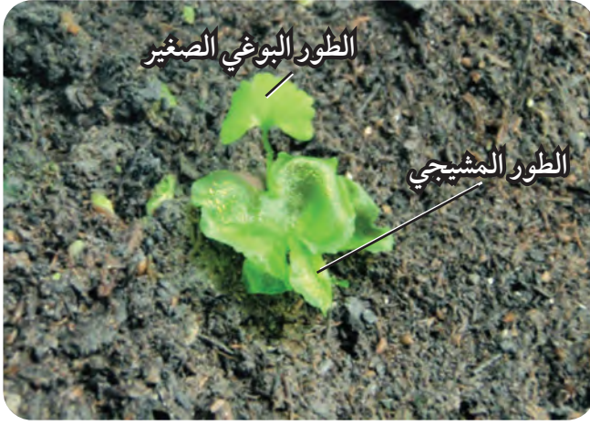
الطور البوغي والطور المشيجي للخنشار