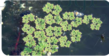
الخنشار المائي Azolla يعيش تكافلياً مع البكتيريا الخضراء المزرقة.