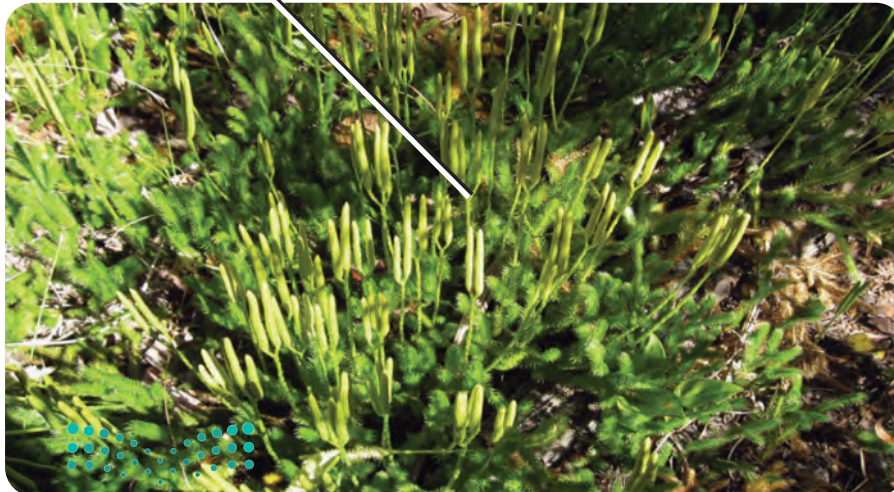
مخلب الذئب Lycopodium sp