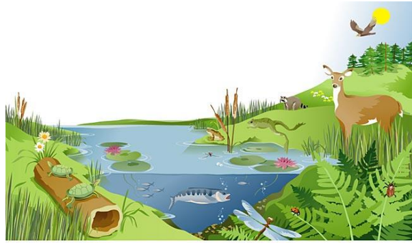
Illustration by Jeff Grader / property of Delta Education