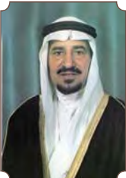
الملك خالد بن عبدالعزيز آل سعود

"لدينا عمق تاريخي مهم جداً موغل بالقدم ويتلاقى مع الكثير من الحضارات. الكثير يربط تاريخ جزيرة العرب بتاريخ قصير جداً، والعكس أننا أمة موغلة في القدم".