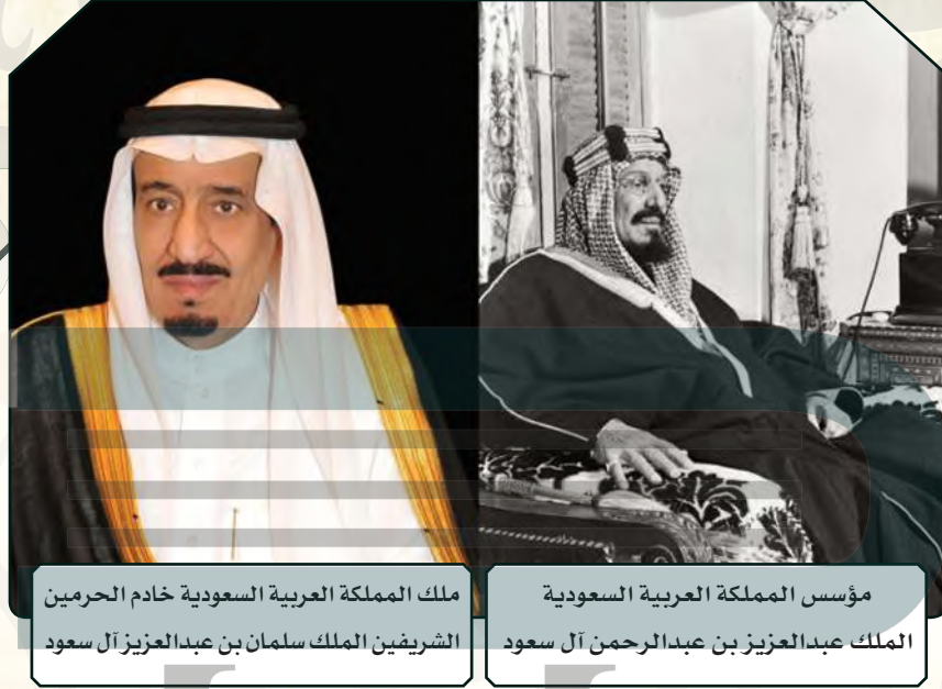
ملك المملكة العربية السعودية خادم الحرمين الشريفين الملك سلمان بن عبدالعزيز آل سعود