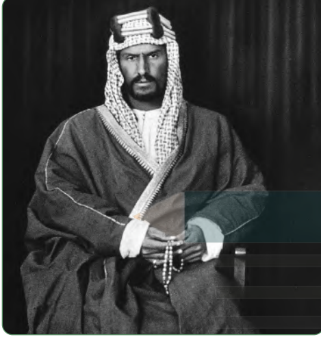
الملك عبدالعزيز عام ١٣١٨هـ

الملك عبدالعزيز بن عبدالرحمن بن فيصل ابن تركي آل سعود، ولد في الرياض عام ١٢٩٣هـ. مؤسس المملكة العربية السعودية عام ١٣١٩هـ.