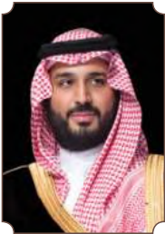
صاحب السمو الملكي الأمير محمد بن سلمان بن عبدالعزيز

"إن إيمان هذا الشعب بالله، وتماسكه وتقانيه في خدمة وطنه والكفاح في سبيل استقلاله وحرية هو السبيل الذي أوصل هذا الشعب وهذا البلد الكريم إلى ما هو عليه الآن".