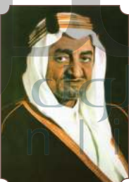
الملك فيصل بن عبدالعزيز آل سعود

"نعتزّ بذكرى تأسيس هذه الدولة المباركة في العام ١١٢٩هـ (١٧٣٧م)، ومنذ ذلك التاريخ وحتى اليوم، أرسيت ركائز السلم والاستقرار وتحقيق العدل. وإن احفاءنا بهذه الذكرى، هو احتفاء بتاريخ دولة، وتلاحم شعب، والصمود أمام كل التحديات، والتطلع للمستقبل، والحمد لله على كل النعم".