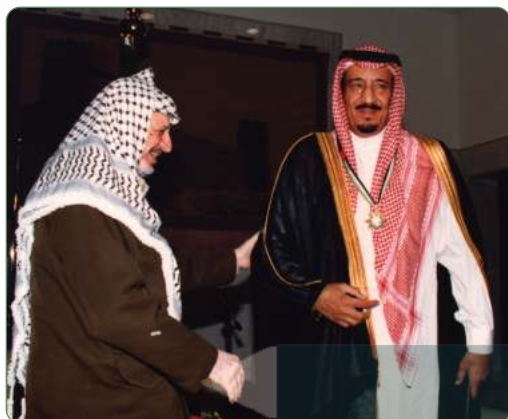
الرئيس الفلسطيني ياسر عرفات يقبل الملك سلمان بن عبدالعزيز وسام فلسطين