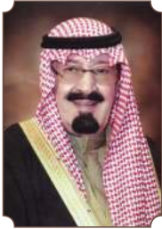
الملك عبدالله بن عبدالعزيز آل سعود

"لقد ملكت هذه البلاد التي هي تحت سلطتي بالله ثم بالشيمه العربية، وكل فرد من شعبي هو جندي وشرطي، وأنا أسير وإياهم كفرد واحد، لا أفضل نفسي عليهم ولا أتبع في حكمهم غير ما هو صالح لهم حسبما جاء في كتاب الله وسنة رسوله ﷺ".