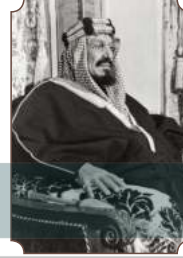
الملك عبدالعزيز بن عبدالرحمن آل سعود

"قامت الدولة السعودية الأولى منذ أكثر من قرنين ونصف على الإسلام، وعلى منهاج واضح في السياسة والحكم والدعوة والاجتماع".