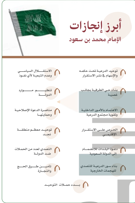
أبرز إنجازات الإمام محمد بن سعود

ومن إنجازاته أيضاً أنه طوّر أسلوب الإدارة في الدولة. وعيّن القضاة لفصل الخصومات بين الناس بالحق، ولم تُعدّ القوة حكماً في الخلافات، وبذلك عرّف أهالي المنطقة نعمة الأمن والاستقرار والعدل.