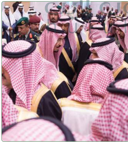
مبايعة الملك سلمان بن عبدالعزيز عام ١٤٣٦هـ

عبدالعزیز التي أصبح رئيساً لمجلس إدارتها منذ عام ١٤١٧هـ، وشهدت نتيجةً لذلك تطوراً كبيراً حتى أصبحت اليوم من المؤسسات الوطنية الرائدة في تحقيق أهدافها.