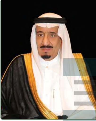
خادم الحرمين الشريفين الملك سلمان بن عبدالعزيز آل سعود ملك المملكة العربية السعودية

ولد خادم الحرمين الشريفين الملك سلمان بن عبدالعزيز في مدينة الرياض عام ١٣٥٤هـ، وتلقى تعليمه على أيدي عدد من العلماء والمشايخ، واستفاد من عناية والده المؤسس الملك عبدالعزيز -رحمه الله- بأبنائه ومتابعتهم شخصياً في الدراسة. التحق بمدرسة الأمراء في الرياض مع إخوانه وتلقى تعليمه الأساسي فيها. واحتفلت مدرسة الأمراء بختمه قراءة القرآن الكريم في عام ١٣٦٤هـ وعُمره نحو عشر سنوات.