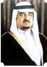
الملك فهد بن عبدالعزيز آل سعود

"قامت الدولة السعودية الأولى منذ أكثر من قرنين ونصف على الإسلام، وعلى منهاج واضح في السياسة والحكم والدعوة والاجتماع".