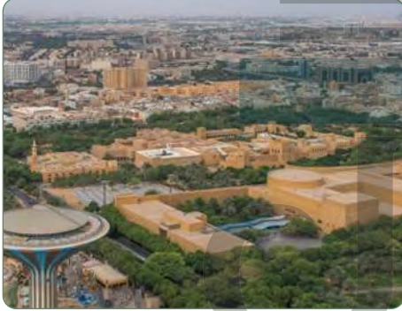
مركز الملك عبدالعزيز التاريخي بمدينة الرياض

ومن الجوانب الإصلاحية الأخرى محلياً صدور عددٍ من الأنظمة التي تحافظ على البيئة والمجتمع.