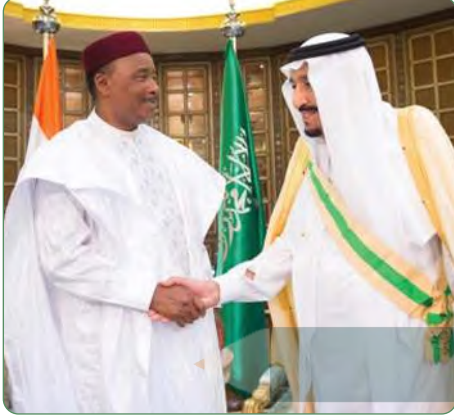
الملك سلمان بن عبدالعزيز يتسلم وسام النيجر