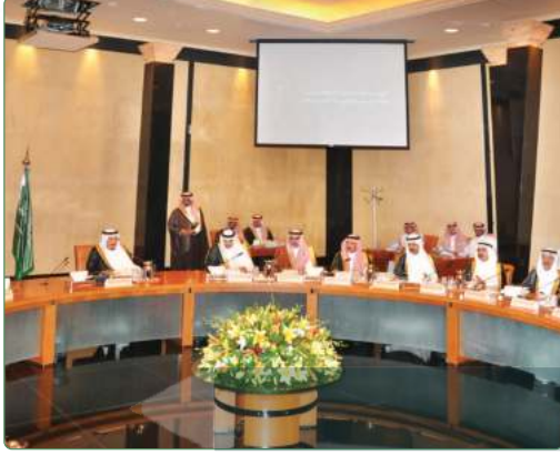
الملك سلمان يرأس اجتماع هيئة تطوير مدينة الرياض