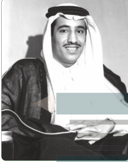
خادم الحرمين الشريفين الملك سلمان بن عبدالعزيز آل سعود في شبابه

ومن ميزات شخصيته حسن التخطيط والمتابعة والمساندة الدائمة للأعمال التي يتولى مسؤوليتها.