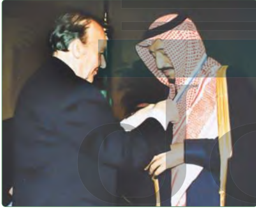
الوسام الذهبي لجمهورية البوسنة والهرسك

أصبحت الرياض اليوم - مدينةً ومنطقةً- أنموذجاً ناجحاً للتطوير والإنجاز برعاية ومتابعة خاصة من لدن الملك سلمان بن عبدالعزيز؛ فلقد نظر إلى الرياض بعيون المستقبل فبهر الجميع بما آلت إليه الأمور اليوم. وسار في التطوير على نهج مدروس ومنظم، وبنى مؤسسات لتحقيق ذلك حتى أصبحت نماذج ناجحة ومميزة في الإدارة والتنفيذ. فمنهجية تطوير مدينة الرياض - والآن هيئة تطوير بوابة الدرعية - تقفان بكل شموخ معالم شاهدة على شخصية الملك سلمان الثاقبة والواعية بأهمية البناء والتطوير. فعند رئاسته لهيئة تطوير مدينة الرياض مدةً تصل إلى نحو الأربعين عاماً نُفِذت برامج إنشائية وُبنى تحتية كبيرة جداً، ومشروعات عملاقة في الرياض، حتى أصبحت الهيئة أنموذجاً يحتذى به في التخطيط والدراسة والتنفيذ.