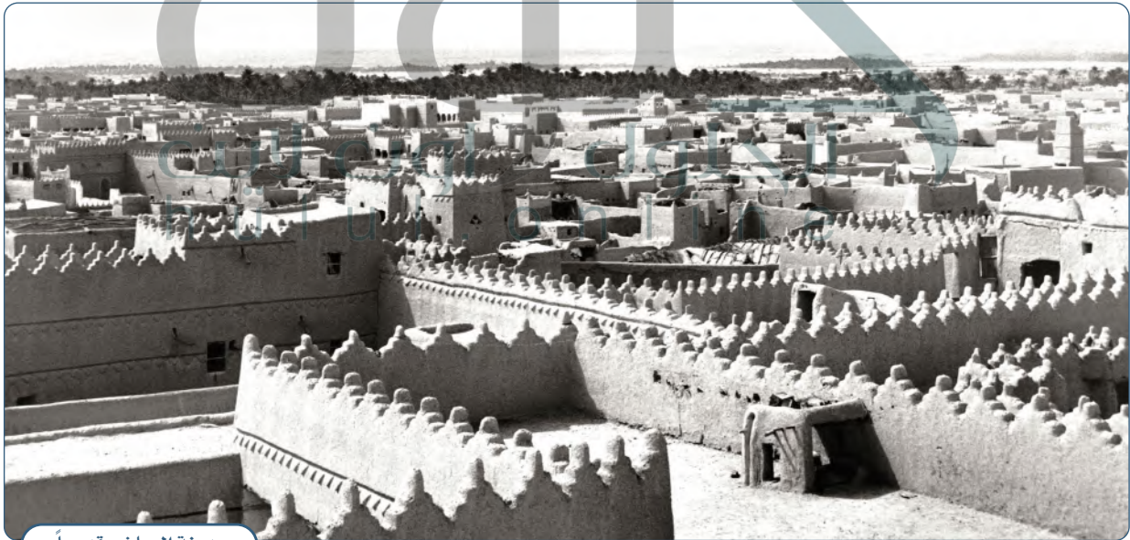
مدينة الرياض قديماً

● عانى الإمام عبدالله بن فيصل بن تركي تلك الخلافات الداخلية، وظهور محمد بن رشيد - أمير حائل الذي عينه الإمام فيصل بن تركي عليها - الذي استغل الفوضى وضعف الأوضاع للاستيلاء على الحكم. توفي الإمام عبدالله بن فيصل بن تركي رحمه الله عام ١٢٠٧هـ في الرياض.