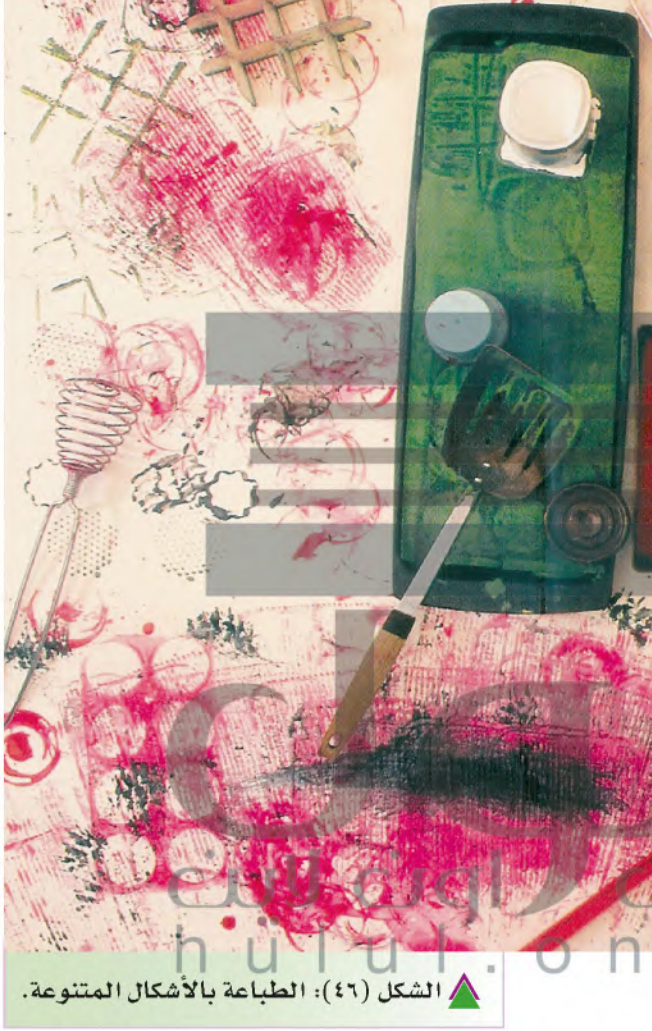
الشكل (٤٦): الطباعة بالأشكال المتنوعة.

في المنزل وبالتعاون مع أحد أفراد أسرتك كرر التجربة باستخدام مواد أخرى، الشكل (٤٦).