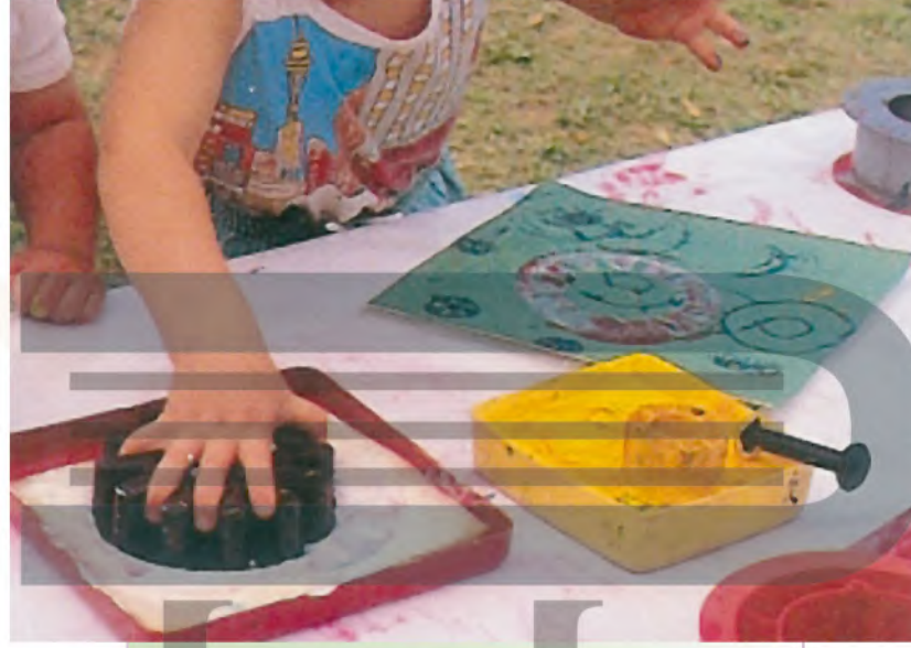
الشكل (٤٢): الطباعة على سطح صلب تحت الورقة.

أضغط بالشكل داخل اللون، ثم أطبعه على ورقة الرسم، الشكلان (٤٢، ٤٣). يجب أن تكون الورقة على سطح متساوي وصلب.