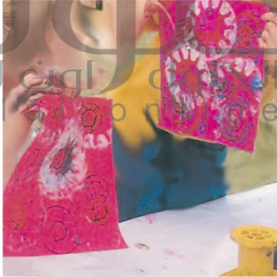
الشكل (٤٣): الشكل النهائي للورقة.