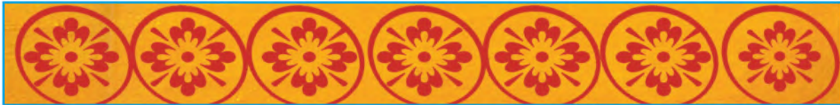
الشكل (٤٥): زخرفة من أشكال الطباعة التي استخدمها الأجداد على الجدران.

أجدادنا في الماضي كانوا يستخدمون الطباعة ليزينوا جدران المنازل، والشكل (٤٥) يوضح نوع من زخرفة الجدران المستخدمة.