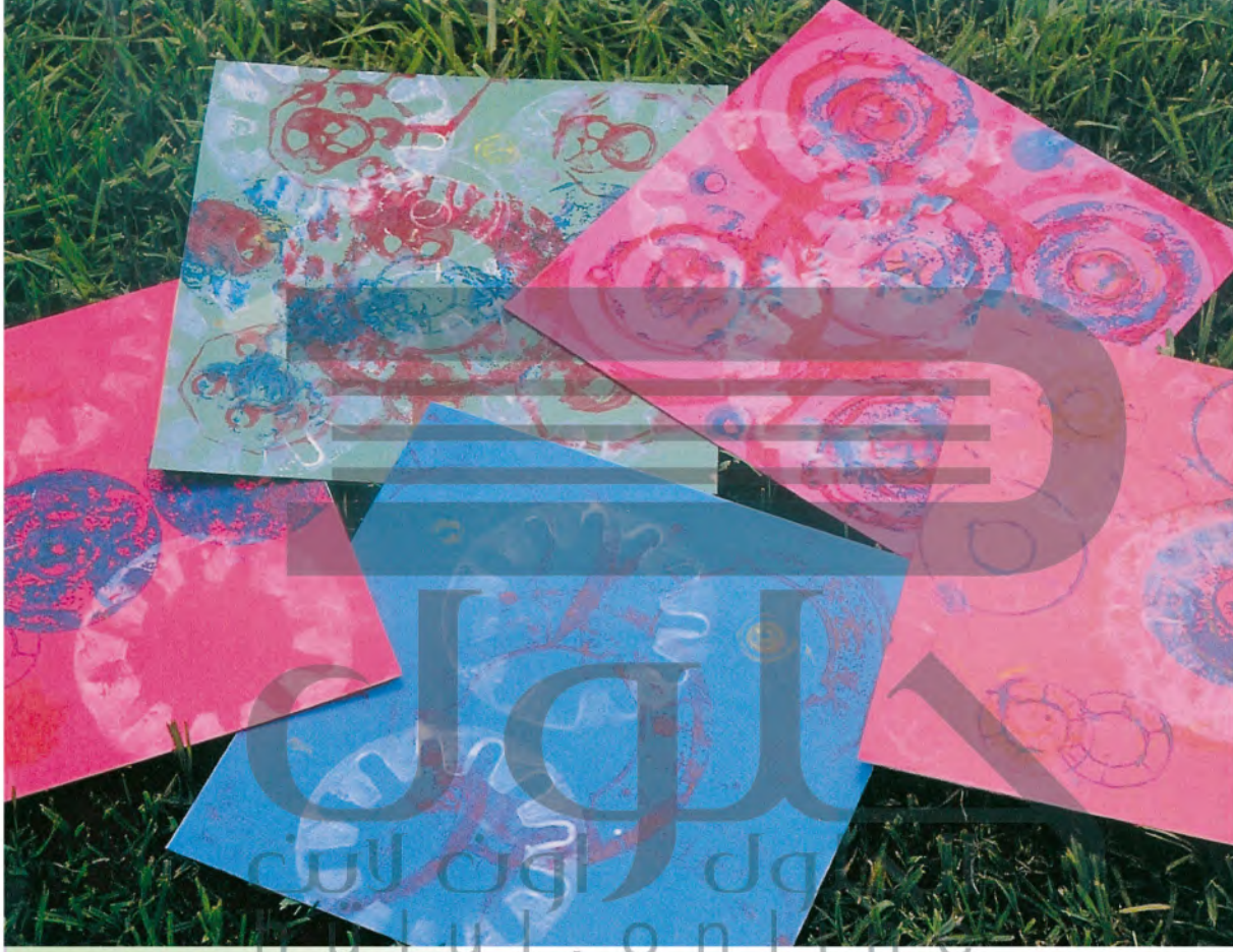
الشكل (٤٤): نترك الأوراق حتى تجف.

بعد الانتهاء أتركها لتجف تماماً وأنتبه حتى لا تتسخ ملابسى، الشكل (٤٤).