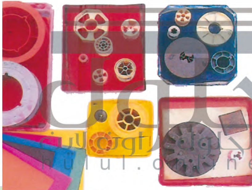
الشكل (٤١): أشكال لها حواف خطية.

هناك أشياء كثيرة لها حواف خطية جميلة. كقالب الحلوى، وألعابي البلاستيكية، والملاعق وغيرها كثير. يمكنني الاستفادة من هذه الأشياء في أعمال الطباعة، الشكل (٤١).