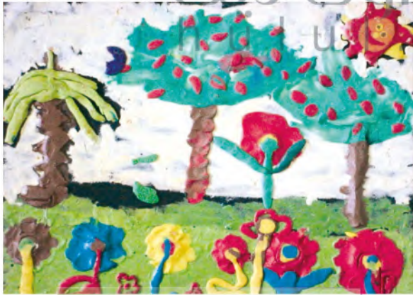
الشكل (٦٢): أعمال من الصلصال.

سأختار منظرًا من بلادي الجميلة، وأرسمه على ورق الصنفرة باستخدام الألوان الشمعية، ثم أقوم بلصق الصلصال على الورق بالفرد أو بعمل كرات صغيرة، أملأ بها المساحات وبألوان متنوعة. انظروا كم هي جميلة أعمال الصلصال، الشكلان (٦١، ٦٢).