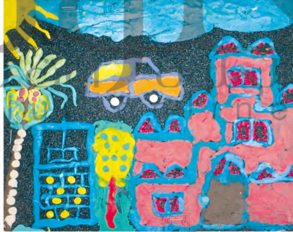
الشكل (٦٤): مدينتي الجميلة.

سأجرب التشكيل على ورق الصنفرة بالصلصال الملون - لوحة من بلادي.