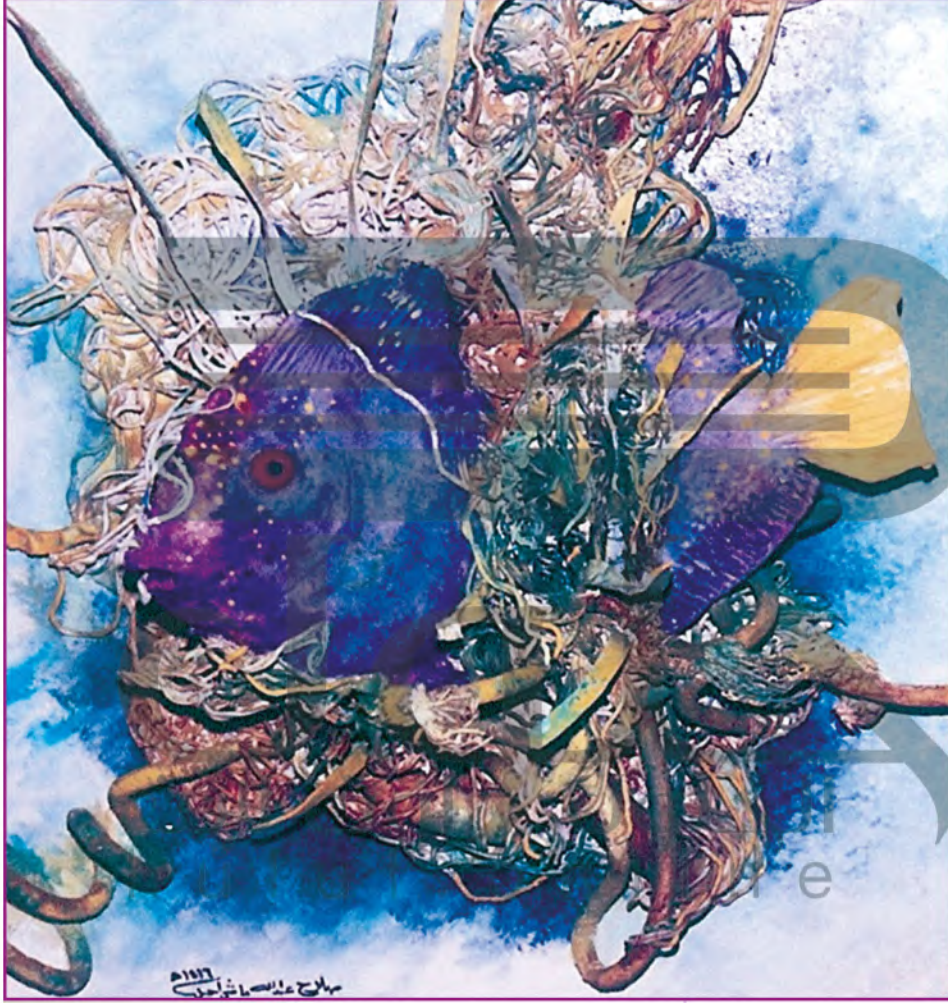
الشكل (٥٥): لوحة للفنان صلاح باسراحييل من مدينة جدة.

كم هي جميلة هذه اللوحة لفنان من بلادي، الشكل (٥٥) ! أتمنى أن أصبح فناناً وأستخدم العجائن في لوحاتي. يمكنني استخدام عجينة الصلصال في أعمالي.