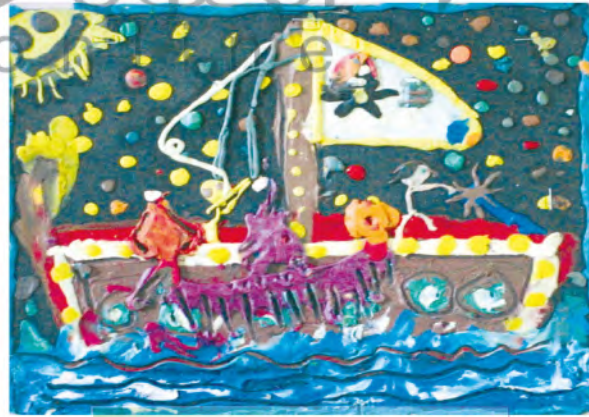
الشكل (٦١): أعمال من الصلصال.