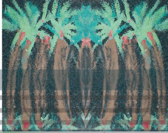
الشكل (٦٣): جذوع النخل.

ما أجمل الخطوط المنحنية والمستقيمة التي استخدمت لجذوع النخل، الشكل (٦٣).