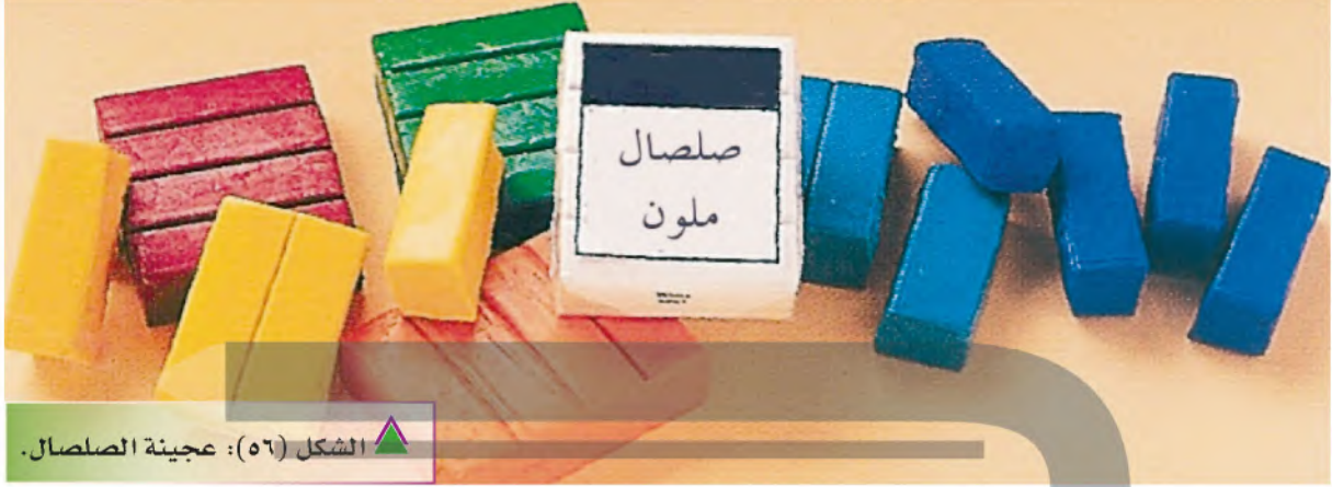
الشكل (٥٦): عجينة الصلصال.

عجينة الصلصال لها ألوان زاهية، وتمتاز بالليوننة، الشكل (٥٦).