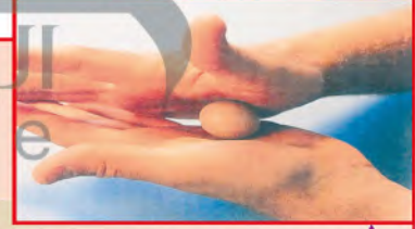
الشكل (٥٨): صنع كرات من الصلصال.

ثانياً: نصنع كرات من الصلصال بتدوير الصلصال بين كفيّنا، الشكل (٥٨).