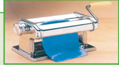
الشكل (٥٩): آلات لتشكيل العجينة الخاصة بالكبار.

ثالثاً: فرد الصلصال على شكل شرائح، والكبار يستخدمون آلات خاصة للفرد كما في الشكل (٥٩).