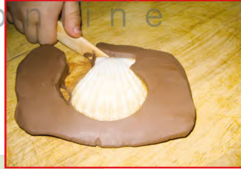
الشكل (٧٧): صناعة أشكال بالصلصال.