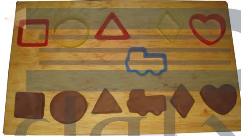
الشكل (٧١): أشكال القوالب.

تُستخدم قوالب القطع المسطحة في تشكيل الطينة لتعطينا هيئة القالب، ولها أشكال متنوعة، الشكل (٧١).