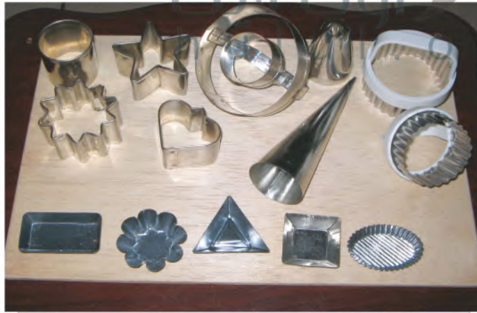
الشكل (٧٢): لنجرب استخدام قوالب الحلوى في التشكيل.

إذا لم تتوفر لدينا قوالب القطع المخصصة للطين الصلصال؛ ففي المنزل يوجد العديد من العناصر يمكننا الاستفادة منها في صنع أشكالاً متنوعة من الطين، كما في الشكل (٧٢).