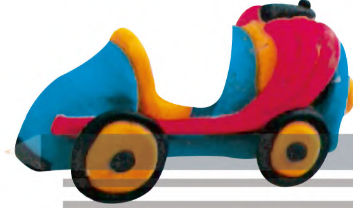
الشكل (٧٦): الصلصال الصناعي الملون في التشكيل.

بعد قيامنا بتجريب الصلصال الصناعي الملون في التشكيل، نذكر أهم ميزاتة.