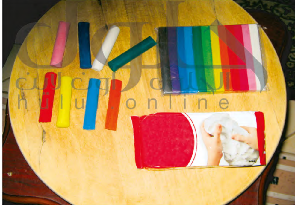
الشكل (٧٥): أنواع الطينات الصناعية.

لنجرّب استخدام بعض الطينات الصناعية في التشكيل، الشكل (٧٥).