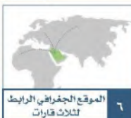
الموقع الجغرافي الرابط ثلاث قارات