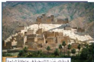
قرية ذي صُن التاريخية هي منطقة الباحة

أهمية السياحة في المملكة العربية السعودية؛ عُنيت حكومة وطني المملكة العربية السعودية ممثلةً في وزارة السياحة، ووزارة الثقافة، والهيئة العامّة للترفيه؛ بتنشيط السياحة، وذلك لعدة أسباب، منها: