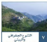
التنوع الجغرافي والبيئي