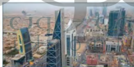
الاقتصاد الكبير عالمياً