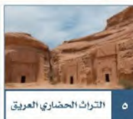
التراث الحضاري العريق