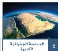
المساحة الجغرافية الكبيرة