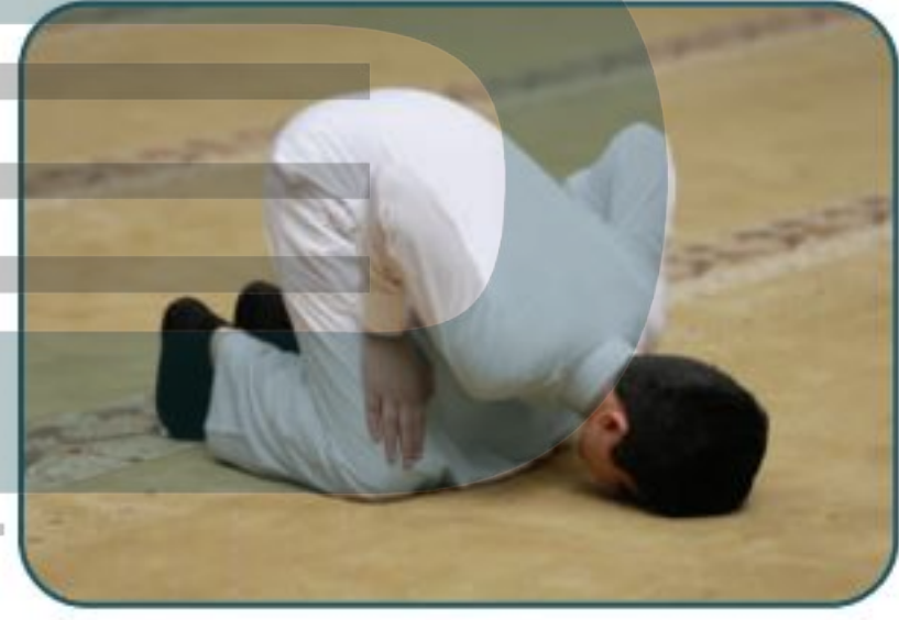
موضع اليدين خطأ