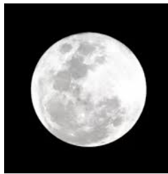
منتصف الشهر بدر