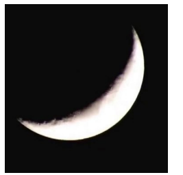
يكون القمر اول الشهر هلال