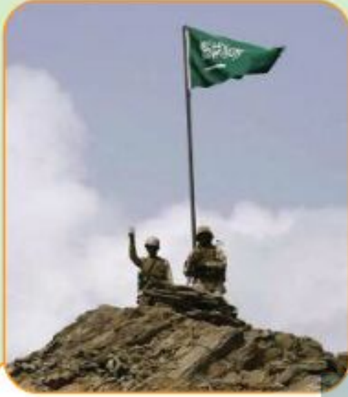
جنودنا البواسل وهم يجاهدون للدفاع عن المملكة ومقدساتها وأهلها على الحد الجنوبي ويرفعون راية المملكة

١- الرباط في سبيل الله: من الأعمال العظيمة في الإسلام للدفاع عن المملكة وعن الحرمين الشريفين وحفاظاً على أرواح المواطنين والمقيمين وحراستهم. فالرباط في سبيل الله خير من قيام ليلة القدر عند الحجر الأسود، فقد جاء من حديث أبي هريرة رضي الله عنه : أن رسول الله ﷺ قال: «موقف ساعة في سبيل الله خير من قيام ليلة القدر عند الحجر الأسود» (١) .