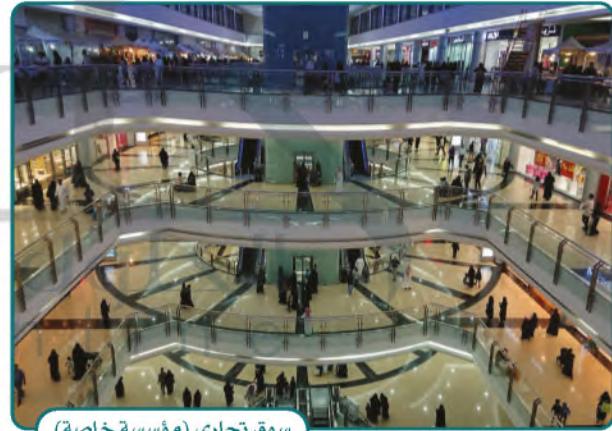
سوق تجاري (مؤسسة خاصة)