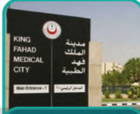
مدينة الملك فهد الطبية بالرياض