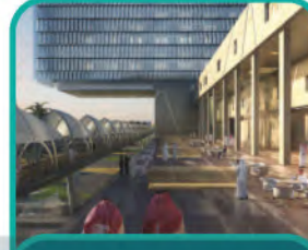
مدينة الملك فيصل الطبية في عسير