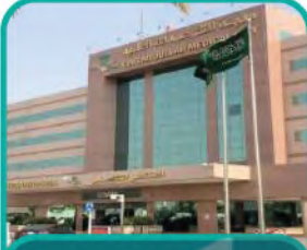
مدينة الملك عبدالله الطبية بمكة المكرمة