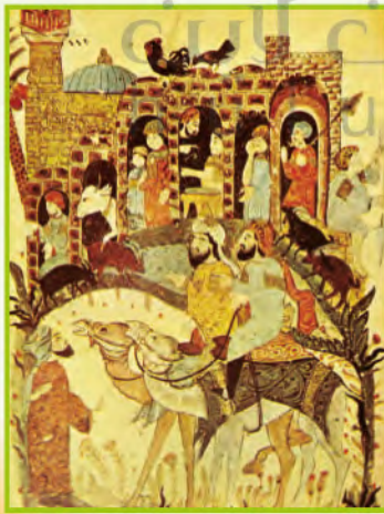
الشكل (١): لوحة للفنان يحيى الواسطي

عزيزي الطالب/ة تأمل الشكل رقم (١) واكتب وصف للجماليات والقيم الفنية التي تناولها الفنان وعناصرها مركزا على: