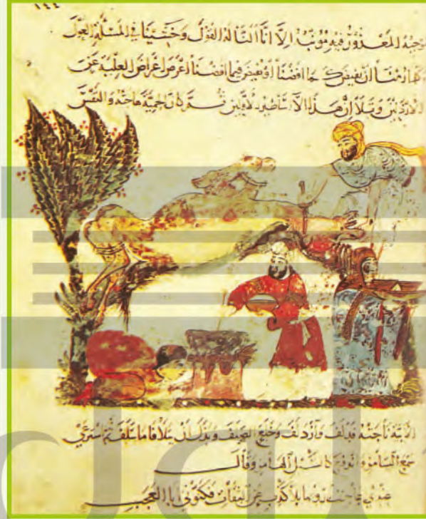
الشكل (٣)، لوحة منمنمة

في السطور الآتية اكتب وصفاً لما تراه في المنمنمة ابتداءً بالموضوع، ثم بالعناصر الشكلية من لون وخط وشكل وزخارف.