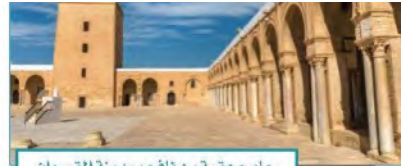
جامع عقبة بن نافع بمدينة القيروان

❶ لم تعرف الأمم فاتحين رُحماء متسامحين مثل العرب، ولا ديناً سمحاً مثل دينهم. (غوستاف ثوبون) ❷ القسطنطينية تسمى حالياً إسطنبول وتقع على مضيق البوسفور بين البحر الأسود وبحر مرمرة.