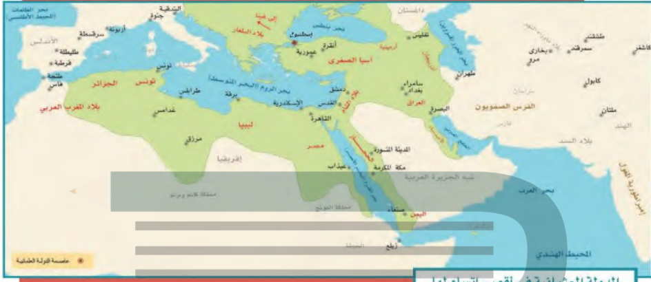
الدولة العثمانية في أقصى اتساع لها

في عهد سليم الأول (٩١٨-٩٢٦هـ) توقف المد العثماني في أوروبا، فاتجه العثمانيون إلى الاستيلاء على البلاد العربية، ويعد سليمان الأول (القانوني) (٩٢٦-٩٧٤هـ) آخر السلاطين العثمانيين الأقوياء، وصلت الدولة في عهده إلى عاصمة النمسا (فيينا)، ووضع القوانين المنظمة لشؤون الدولة؛ ولذا لُقّب بالقانوني، وواصل سياسة والده فأكمل الاستيلاء على معظم البلاد العربية.