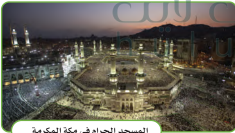
المسجد الحرام في مكة المكرمة

أنني مواطنة سعودية وديني الإسلام ولغتي العربية وأردد دعاء سيدنا إبراهيم وأعتز بتاريخ وطني وتراثه وأطلع لصنع مستقبل مشرق