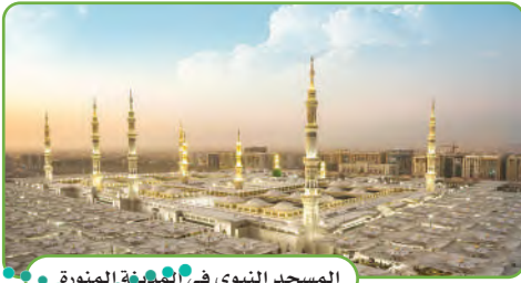
المسجد النبوي في المدينة المنورة