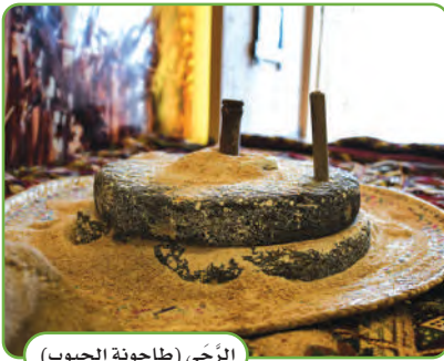
الرّحى (مطحونة الحبوب)