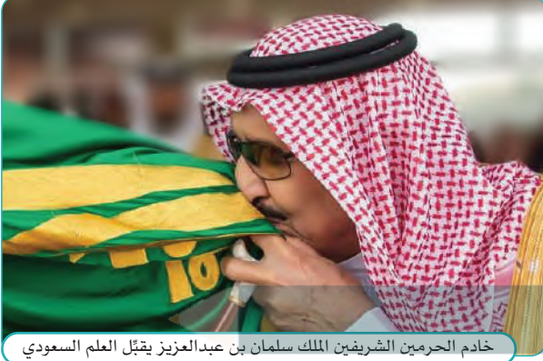
خادم الحرمين الشريفين الملك سلمان بن عبدالعزيز يقبل العلم السعودي