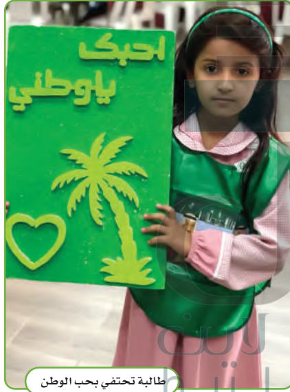
طالبة تحتفي بحب الوطن

هو يوم توحيد البلاد، على يد الملك عبدالعزيز بن عبدالرحمن الفيصل آل سعود في عام ١٣٥١هـ، والذي يوافق ٢٣ سبتمبر في كل عام، وهو يوم فخر لكل مواطن سعودي يعتز فيه بالإنجاز والبناء.