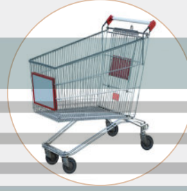
فِي السُّوقِ التِّجَارِيِّ