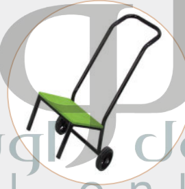
لِحْمَلِ الْحَقَائِبِ الثَّقِيلَةِ