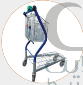
فِي السُّوقِ التِّجَارِيِّ