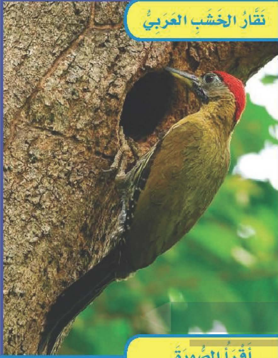
نَقَّارُ الْخَشَبِ الْعَرَبِيُّ