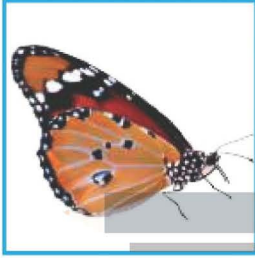
فراشة مُكتملة النمو

٩- التتابع. أرتب صور دورة حياة الفراشة التالية باستخدام الأرقام من ١ إلى ٤.