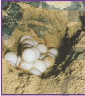
الْبَيْضَةُ: تَرْحِفُ الْإِنَاثُ لِتَضَعَ بُيُوضَهَا فِي رَمْلِ الشَّاطِئِ.

لَا تَمُرُّ الزَّوَاحِفُ وَالْأَسْمَاكُ وَالطُّيُورُ بِمَرَحَلَةِ التَّحَوُّلِ؛ فَهِيَ تُشَبِّهُ آبَاءَهَا عِنْدَمَا تَفْقُسُ.