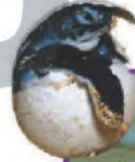
السَّلْحَفُ الصَّغِيرُ: تَفْقُسُ عَلَى الشَّاطِئِ ثُمَّ تَرْحِفُ بِسُرْعَةٍ نَحْوَ مَاءِ الْبَحْرِ.