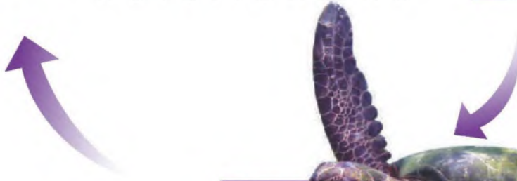
سَلْحَفَةٌ مُكْتَمِلَةٌ النُّمُو: تَنْمُو حَتَّى ١٤٠ كِجَم، وَتَبْقَى الْإِنَاثُ فِي الْبَحْرِ حَتَّى يَحِينُ مَوْعِدُ وَضْعِ الْبَيْضِ.