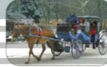
حصان يجز عربة