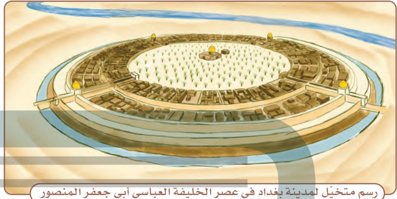
رسم متخيل لمدينة بغداد في عصر الخليفة العباسي أبي جعفر المنصور

بنى الخليفة أبو جعفر المنصور مدينة بغداد في عام ١٤٥هـ، وأصبحت عاصمة الدولة العباسية.