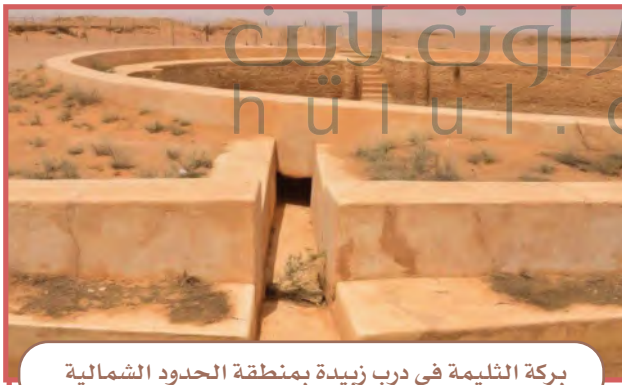
بركة الثليمة في درب زبيدة بمنطقة الحدود الشمالية

لا تزال آثار هذا الدرب قائمة في بلادنا، ويجب أن نحافظ عليها