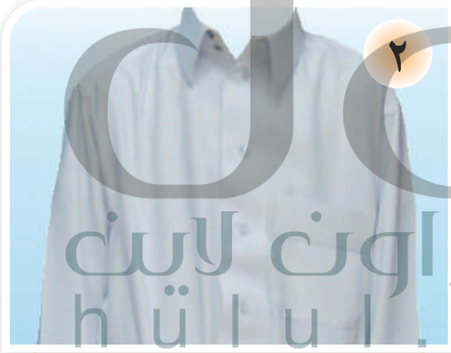
لبسُ أجملِ الثيابِ

يومُ العيدِ يومُ عبادةٍ وشكرٍ ، ويومُ فرحٍ وسرورٍ ، ويستحبُّ للمسلمِ في هذا اليومِ :