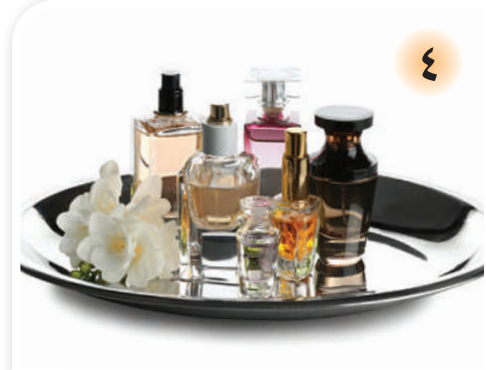
التطيب للرجال خاصة