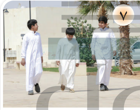
الذهاب إلى المصلى من طريق، والرجوع من طريق آخر.