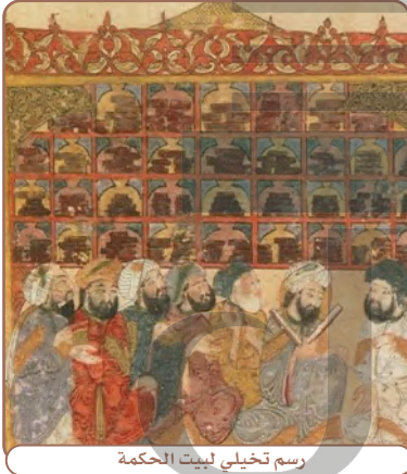
رسم تخيلي لبيت الحكمة

أنَّ الخليفة العباسي المأمون عندما دخل قبرص، وعدَّ أهلها ألا تؤخذ منهم الجزية (أموال تؤخذ مقابل الحماية) إذا هم أرسلوا له كتبهم في العلوم. وقد أمر بترجمتها، واستفاد منها المسلمون وزادوا عليها وأبدعوا.