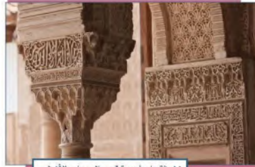
زخرفة على أعمدة قصر الحمراء بالأندلس