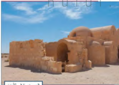
قسم عمرة في الأردن

اعتنى المسلمون ببناء المدن في الأماكن التي فتحوها لأغراض متعددة؛ إما لتكون عواصم للدول الإسلامية، وإما لأغراض عسكرية، أو اقتصادية، أو دينية. ومن أهم المدن الإسلامية: البصرة، والكوفة، وبغداد، والقيروان، والقاهرة، وغيرها.