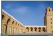
مسجد عقبة بن نافع