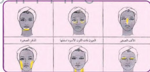
شكل (٢١): مناطق التفتيح لبعض أجزاء الوجه