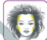
شكل (١٩): نقاط التفتيح في الوجه